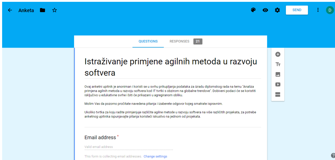
Slika 1: Google Forms sučelje za uređivanje anketnih pitanja

Slika 1 prikazuje Google Forms sučelje za uređivanje anketnih pitanja.