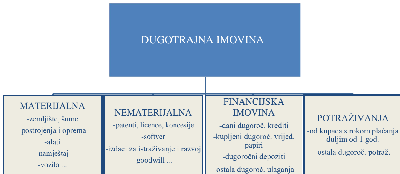
Slika 2 : Oblici dugotrajne imovine