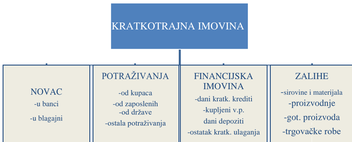
Slika 1 : Oblici kratkotrajne imovine