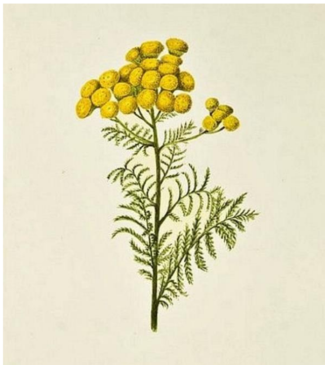
Slika 1. Biljka smilja