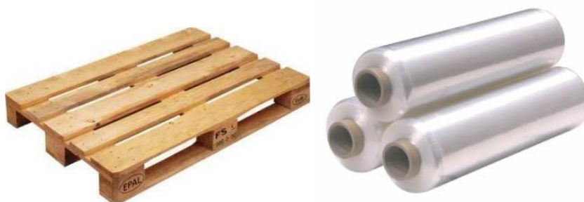
Slika 4: Euro paleta i strech folija

Prilikom skladištenja i transporta koriste se EURO palete dimenzije 1200 x 1000 mm. One su konstruirane kao dvopodne palete sa 3 ili 4 nožice koje joj pružaju otpornost pri savijanju tako da se omogući ulaz vilicama viličara na način da dignu cijelu paletu i lako manipulira njome. Proizvodi na paletama se mogu različito slagati, što prvenstveno ovisi o vrsti proizvoda, pa se tako mora paziti da se lomljivi proizvodi slažu na vrh palete da se ne bi oštetili. Strech folija koristi se za stabiliziranje paletiziranog 23 tereta različitih vrsta i dimenzija te zaštita zapakirane robe od prašine i vlage. Odlično prijanjanje omogućuje lako omatanje oko proizvoda. Folija štiti proizvode od vanjskih utjecaja i mogućih oštećenja pri transportu. Osnovna karakteristika termo folije je da služi kao pokrivalo za robu na paletama koje čuvaju temperaturu u ljetnim mjesecima za lako pokvarljivu robu.