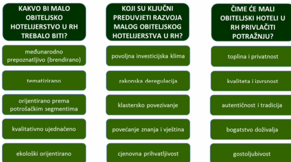
Slika 5.: Temeljne odrednice razvojne vizije maloga obiteljskog hotelijerstva RH