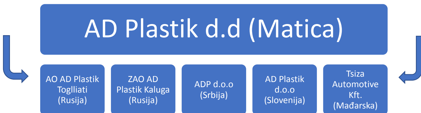
Slika 4. Organizacijska struktura