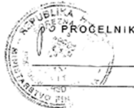
Slika 3a: Zahtjev za podnošenje prijedloga za osiguranje novčane tražbine