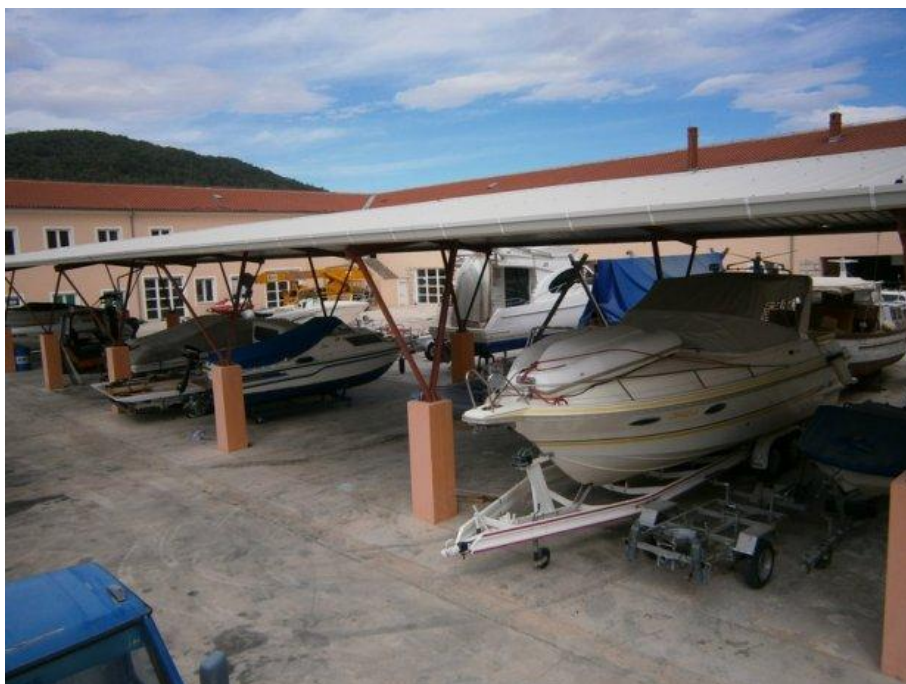
Slika 2: Prikaz suhe marine