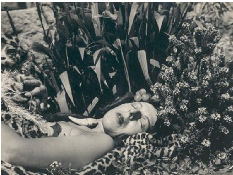
Slika 11. Claude Cahun, Autoportret , oko 1939.