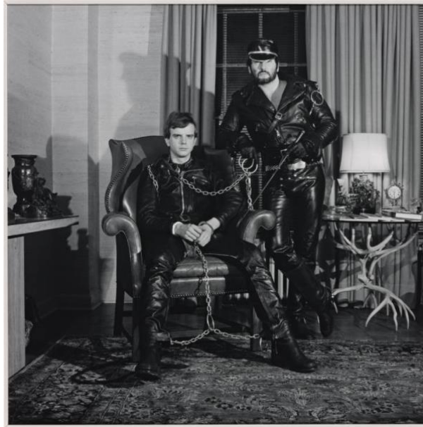
Slika 3. Robert Mapplethorpe, Brian Ridley and Lyle Heeter , 1979.

Krajem sedamdesetih, Mapplethorpe se sve više počeo interesirati za dokumentiranje svojih prijatelja na njujorškoj S&M sceni. Često ih je fotografirao gole, a ponekad ih je pokazivao uključene u seksualne činove. Svojim šokantnim sadržajem i također izvanrednim tehničkim majstorstvom, postavljen je u središte rasprava oko samoizražavanja i cenzure u umjetnosti. Testirao je granice kreativne slobode i imao važno mjesto u povijesti umjetničke borbe da svijet prikažu iskreno i istinito. 26