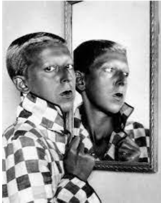
Slika 10. Claude Cahun, Autoportret , oko 1929.

ono što je mnogima nespojivo i neprirodno. Nježno cvijeće kontrastira izraženim crtama blijedog lica i tamnom ružu na ustima. Na ovome autoportretu Cahun izražava upravo tu neutralnost koja mu odgovara te spaja (kulturom i tradicijom nametnute) značajke oba roda.