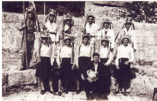
Bijeli maškari 1964. godine