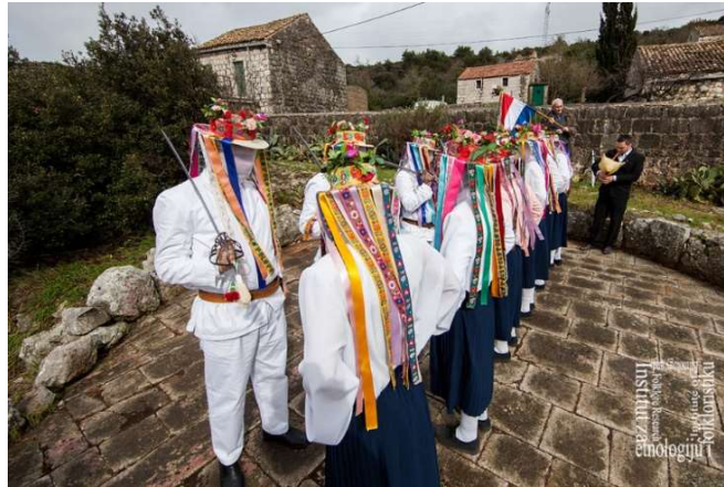
Bijeli maškari u selu Prisoju 2016. godine