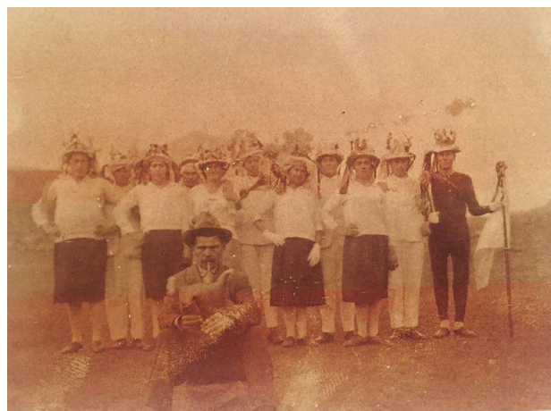
Bijeli maškari s početka 20. stoljeća