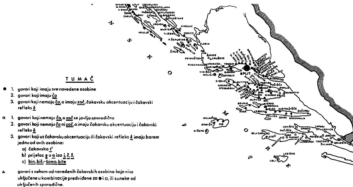
Slika 2. Isječak karte čakavskog narječja (Moguš, 1977: 105).