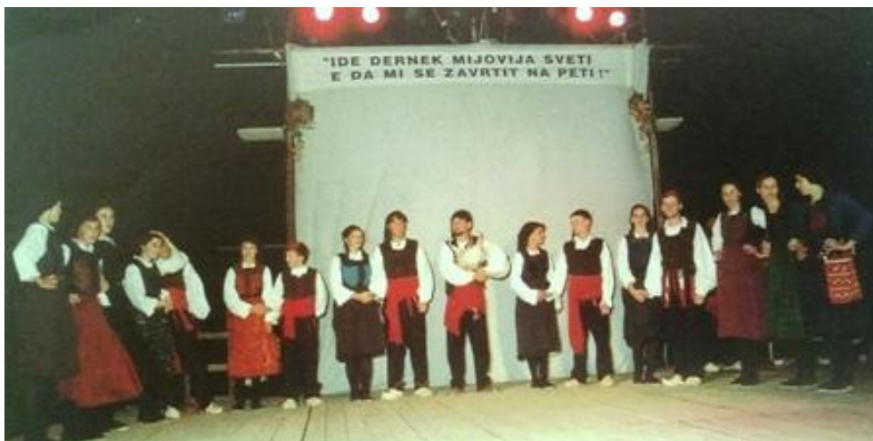
Slika 3. Proslava sv. Mihovila, pučka veselica