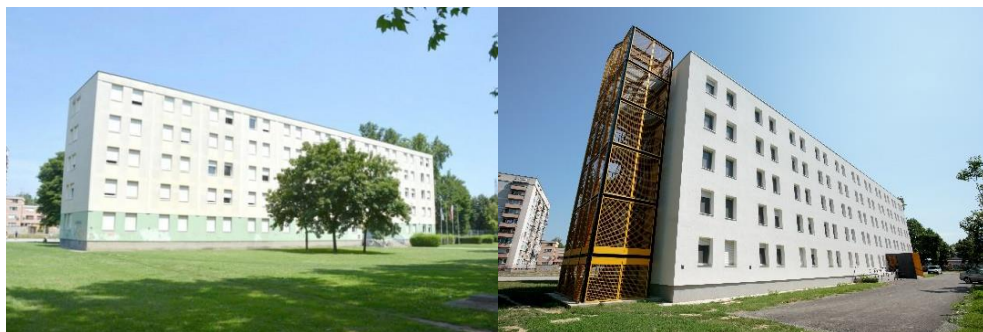
Slika 1. Studentski dom prije (a) [3] i poslije (b) rekonstrukcije [autor: Mario Miloloža]

Rekonstrukcija Studentskog doma Ivan Goran Kovačić trajala je od ožujka 2015. godine do srpnja 2017. godine uključujući vrijeme projektiranja i izvođenja radova na objektu. Zbog visokih troškova grijanja, na zgradi je 2002. bila ugrađena nova PVC stolarija te su obnovljena pročelja zgrade i slojevi ravnog krova. Zgrada je prije rekonstrukcije posjedovala energetski certifikat C energetskog razreda, no s obzirom na to da je kvaliteta izvedenih radova bila relativno niska, projektom su predviđeni novi zahvati za sanaciju. Cilj rekonstrukcije objekta bio je podizanje standarda stanovanja u studentskom domu koji je bio neprimjeren današnjem standardu pri čemu se vodila briga i o studentima s invaliditetom i smanjene pokretljivosti kao i o znatnom poboljšanju energetske učinkovitosti same zgrade. Glavni projekt rekonstrukcije izradile su tvrtke BP Consulting d.o.o. (arhitektonski projekt), MHM Inženjering d.o.o. (građevinski projekt), INEL d.o.o. (eletrotehnički projekt) i HRASTOVIĆ Inženjering d.o.o. (projekt strojarskih instalacija).