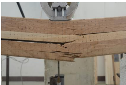
Slika 5. Uzorak S1