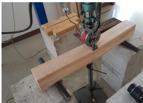
Slika 1. Eksperiment

Sila se unosi hidrauličkom prešom postupno kroz vrijeme do trenutka otkazivanja elementa na polovini duljine elementa. Pomaci i deformacije su mjereni pomoću LVDT-a (linearni varijabilni diferencijalni transformator) na sredini uzorka. LVDT senzor pretvara pravocrtne pomake objekta za koji je mehanički pričvršćen u odgovarajući električni signal. Korišten je senzor proizvođača HBM, nominalnog hoda 100 mm. Za mjerenje sile korištena je mjerna ćelija proizvedena na FGAG-u nazivne nosivosti 150 kN.