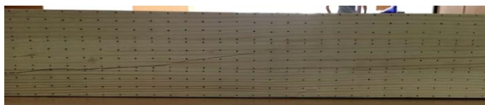
Slika 6. Uzorak S3