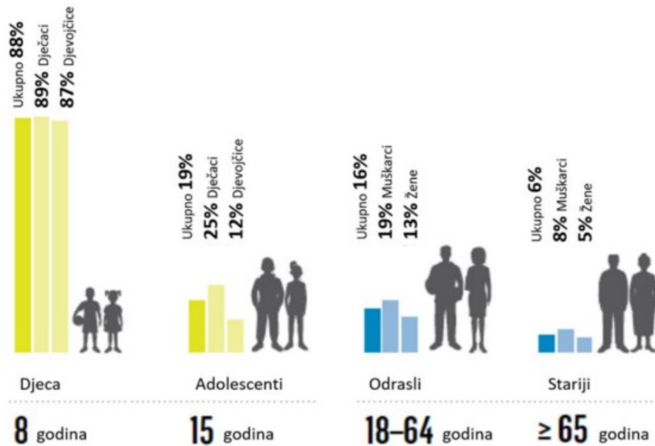
Slika 1: Fizička aktivnost stanovništva u Republici Hrvatskoj

Izvor: http://www.euro.who.int/en/health-topics/disease-prevention/physicalactivity/data-and-statistics/physical-activity-fact-sheets/physical-activity-country-factsheets/croatia )