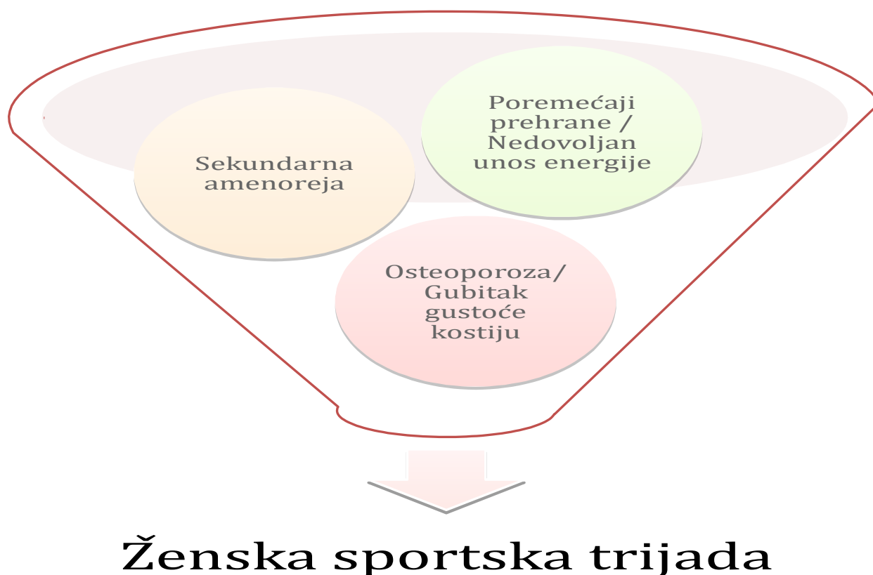
Slika 3: Ženska sportska trijada

Ženska sportska trijada opisana je i definirana 1992. od Američkog koledža za sportsku medicinu. Objedinjuje nisku dostupnost energije sa ili bez poremećaja prehrane, menstrualnu disfunkciju i narušeno zdravlje kostiju. Definicija je dopunjena 2007. godine da bi se u nju uključio čitav spektar disfunkcija vezanih uz dostupnost energije, menstrualnu funkciju i gustoću kostiju, a ne samo neka od stanja.