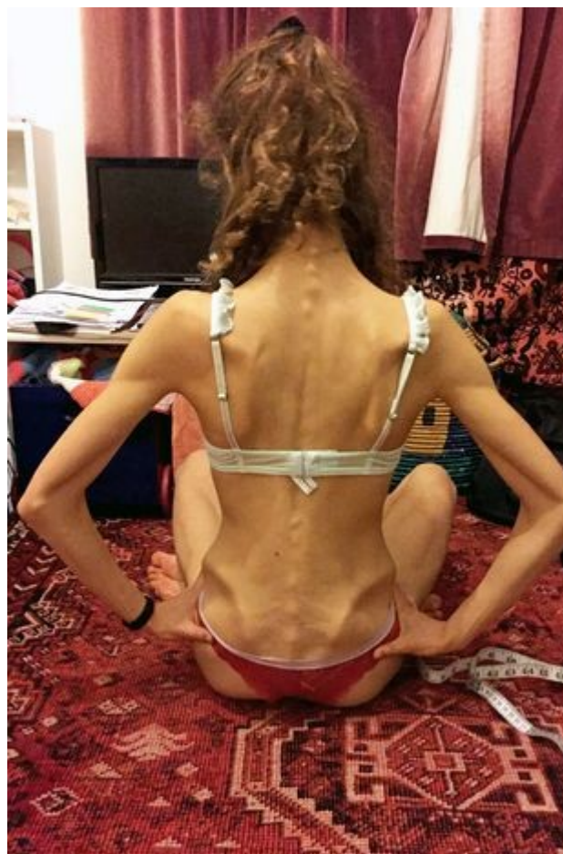
Slika 4: Balerina 18. g, oboljela od anoreksije