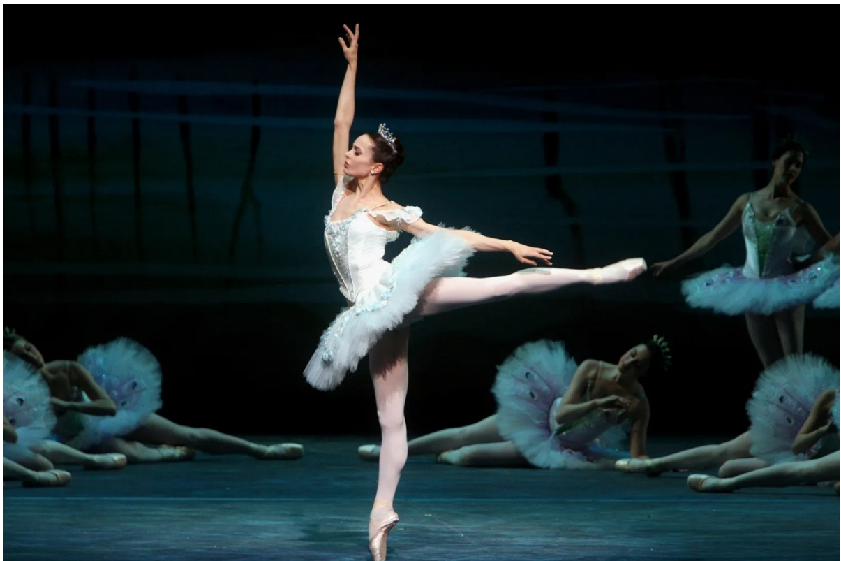
Slika 2: Balerina, Diana Vishneva, 2007