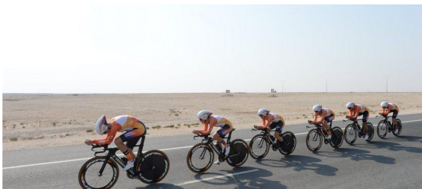
Slika4. Tipičan primjer “ draftinga .”

Cilj svakog natjecatelja u triatlonu je ušteda energije tijekom utrke kako bi si povećao šanse za dobar plasman. Jedan od načina je tzv. „ drafting “ tj. iskoristiti druge sportaše kako bi umanjili jednu varijablu koja utječe na uspješnost u triatlonu, a to je otpor vode u plivanju i zraka u biciklizmu, te nešto manje u trčanju (Brisswalter i Hauswirth, 2008).