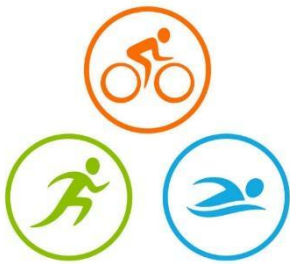
Slika 1. Logo triatlona

Triatlon je prvenstveno sport izdržljivosti kojeg čine tri različite discipline koje se odvijaju uvijek istim redoslijedom. Start utrke započinje plivanjem i do kraja utrke je potrebno proći dvije triatlonske tranzicije u kojima je potrebno promijeniti opremu za slijedeću disciplinu. Prva tranzicija u triatlonu se odvija prelaskom s plivanja na biciklizam, a zadnja tranzicija povezuje biciklizam i trčanje (Fitzgerald, 2016).