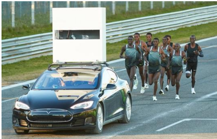
Slika5. Nike "sub2h" projekt (Monza, Italija)

Termin "drafting" ili "draftanje" označava vožnju neposredno iza natjecatelja koji se nalazi ispred kako bi se smanjio otpor zraka, a rezultat je manji utrošak. Točnije, procjenjuje se da se količina utrošene snage tada može smanjiti za 25% kako bi se održala ista brzina. Korist je veća što je veća brzina vožnje i što zavjetrina pokriva veću površinu. Koliko je zapravo zavjetrina važna, možemo vidjeti u dva pokušaja probijanja granica ljudskih mogućnosti u maratonu od 2 sata. Nike „sub2h project“ i „Ineos 1:59 Challenge“ su izabrali nekoliko sportaša, a jedan od njih je bio Eliud Kipchoge kojem je uspjelo (u umjetno napravljenim uvjetima utrke) otrčati 1:59:40. Jedan od faktora uspješnosti je bilo trčanje Kipchoge-a u zavjetrini svojih „pacer-a“ koji su formirali oblik strijele.