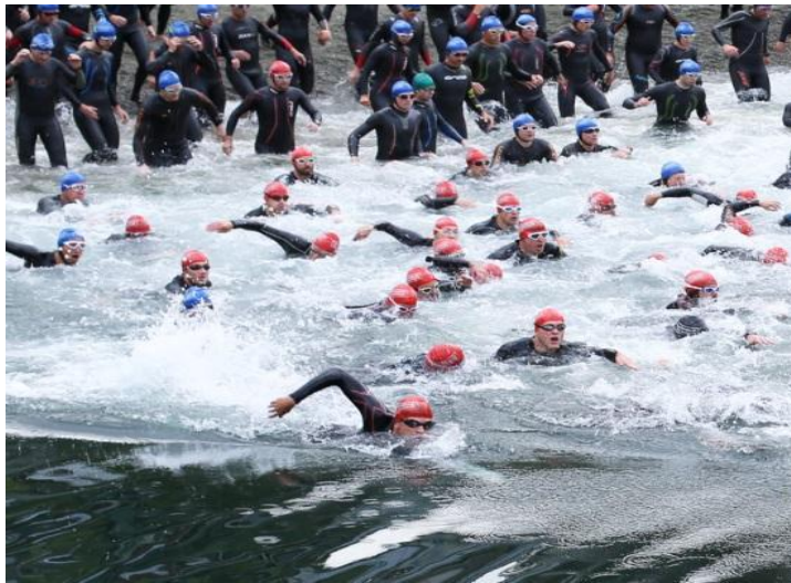
Slika 6. Start Ironman utrke

ušteda energije putem „draftinga“ najbolje se primjeti u disciplini koja dolazi nakon plivanja, a to je biciklizam. Natjecatelji koji nisu plivali u skupini su imali manju efikasnost u disciplini biciklizam u prosjeku 4.8% (Delextrat i sur., 2003). Nadalje, vrhunski sportaši primjenjuju kod prve discipline u plivanju strategiju ubrzanog tempa na početku utrke, u usporedbi sa tempom tijekom cijelog prvog dijela plivanja koji je vrlo ujednačen. Razlog tomu je što svaki natjecatelj želi zauzeti dobru poziciju u skupini zbog „draftinga“ i izravnije putanje (Vleck i sur., 2008).