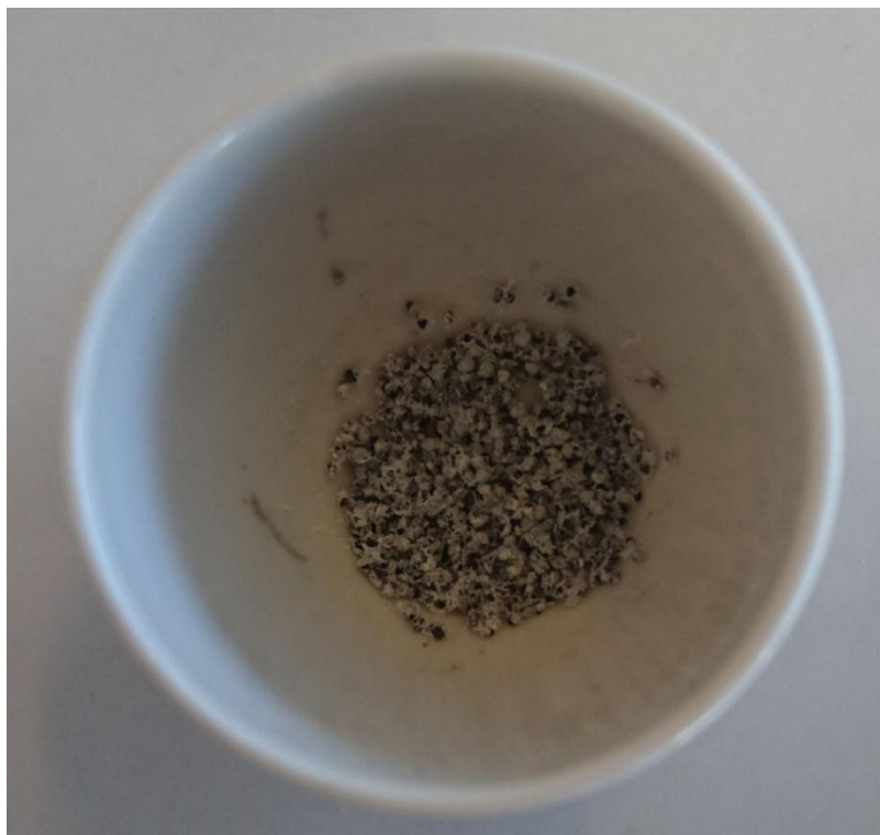
Slika 2.8. Uzorak rukole nakon žarenja