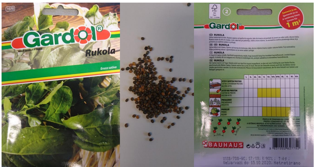
Slika 2.2. Sjeme rukole ( Eruca sativa Mill.)