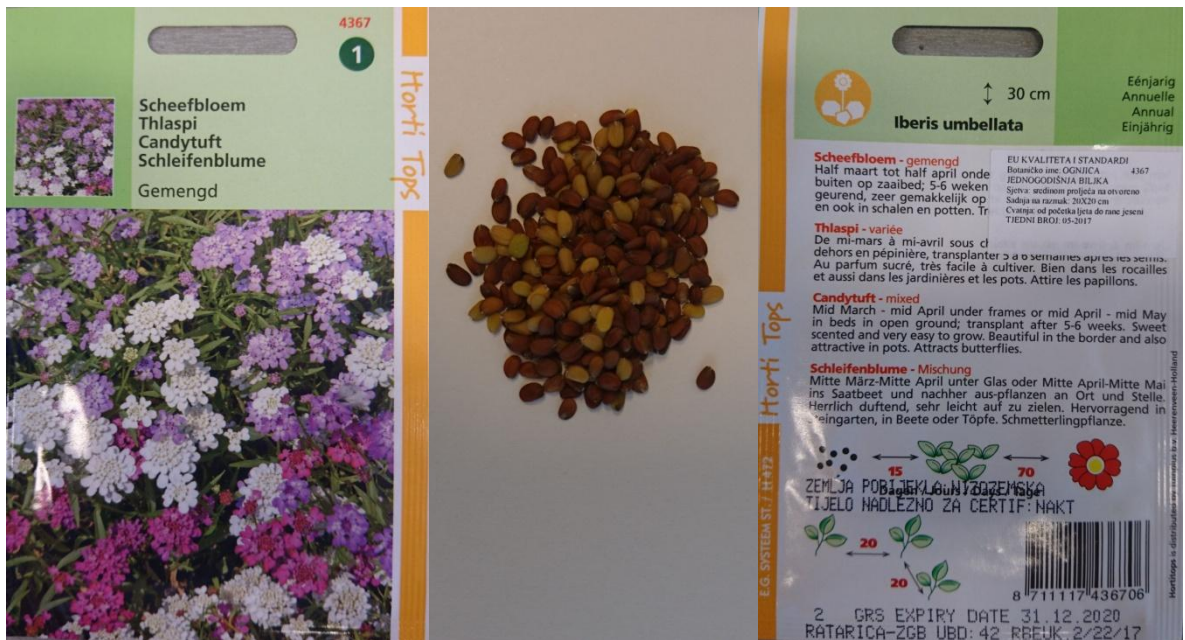
Slika 2.1. Sjeme štitaste ognjice ( Iberis umbellata L.)

U eksperimentalnom dijelu rada korištene su sjemenke štitaste ognjice ( Iberis umbellata L.) proizvođača Tuinplus b. v. Heerenveen, Nizozemska (slika 2.1.) i rukole ( Eruca sativa Mill.) proizvođača Bauhaus-Zagreb k.d., slika 2.2.