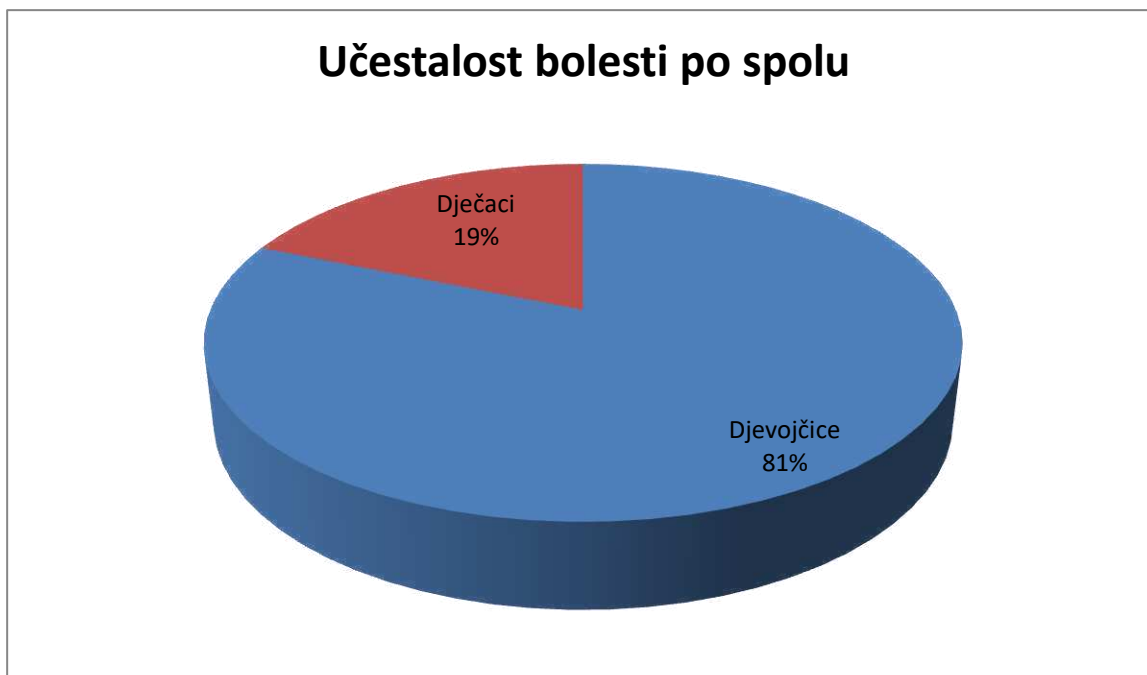
Slika 2. Učestalost tireotoksikoze po spolu

Od 56 bolesnika s dijagnozom GB njih 15 (26.7 %) je ušlo u remisiju, a relaps bolesti dogodio se u njih šestoro (40%) (Tablica 6). Bolesnike s GB liječili smo dvjema metodama definitivnog liječenja. Tako smo od ukupnog broja bolesnika, njih 56, 15 bolesnika operirali (napravljena je tireoidektomija), a njih 4 liječili radioaktivnim jodom (Tablica 7).