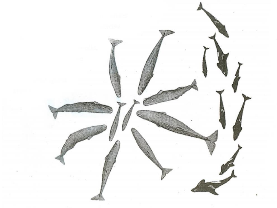
Slika 6. Prikaz „marguerite“ formacije.