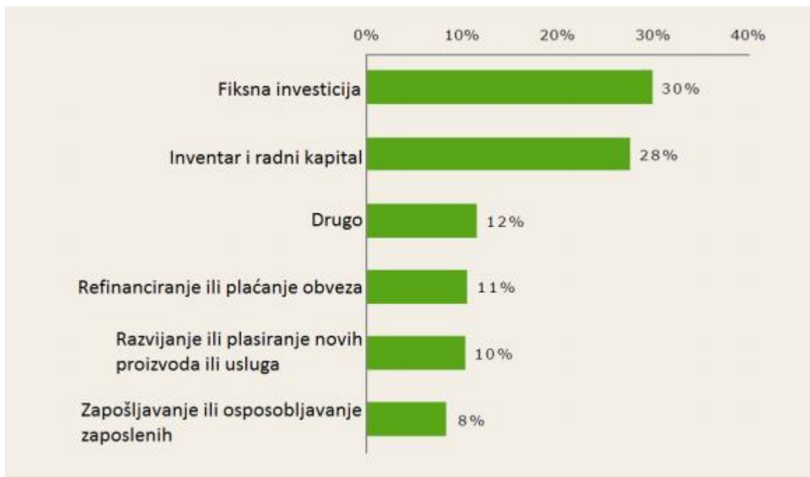
Grafikon 4. Svrha korištenja eksternog financiranja od malih i srednjih poduzeća

Izvor: Trojan, K. (2015.) op. cit. str. 14, https://repositorij.unin.hr/islandora/object/unin%3A40/datastream/PDF/view [10.07.2020.]