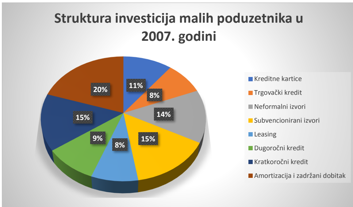
Grafikon 3. Financiranje investicija malih poduzetnika u 2007. godini