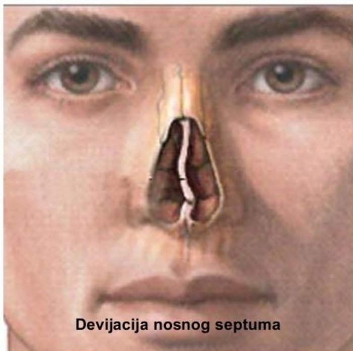
Slika 2. Devijacija septuma

Iskrivljenost nosne pregrade može stvarati neugodne tegobe i takvu pojavu nazivamo devijacijom septuma. Ona je česta pojava i može biti urođena, razviti se tijekom života, te nastati kao posljedica povrede nosa (16). Pacijenti kod kojih je prisutna deformacija nosne pregrade žale se na nazalnu opstrukciju. Prisutnost i stupanj deformacije septuma utvrđuje se prednjom rinoskopijom i endoskopijom (17).