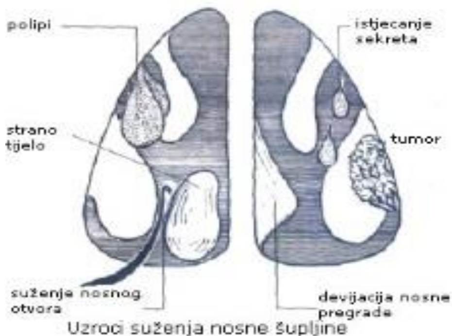
Slika 1. Uzroci suženja nosne šupljine

nerijetko susrećemo i druge patološke poremećaje (npr. septum nosa i polipi) koji dovode do komplikacija i problema u odvijanju normalnog rada receptora nosne šupljine, odnosno prirodnih i pravilnih funkcija respiratornog sustava (14). Premda je popis bolesti gornjeg respiratornog sustava veoma velik i dug u ovom radu se najčešće spominje devijacija septuma zbog relativno velike učestalosti i bitnog utjecaja na strujanje udahnutog zraka kroz nosnu šupljinu.