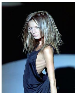
Slika 2. Model

Prema nekim podacima, poremećaji hranjenja se javljaju u oko 4 % adolescenata. AN je u posljednjem desetljeću sve češća, i to 20 puta više javlja kod djevojčica adolescentne dobi, nego kod dječaka (1). Prosječna dob početak bolesti je 17 godina, rijetko se javlja nakon 40. godine. Neki podaci upućuju na dva vrhunca, u dobi od 14 i 18 godina te je povezana sa stresnim životnim razdobljem, kao što je odlazak na studij (9). Prema nekim istraživanjima (9), smatralo se da je AN češća u višim društvenim slojevima. No, novija istraživanja (10) povezuju bolest s profesijama čiji je imperativ mršavost, kao što su balet i manekenstvo. Cjeloživotna prevalencija za AN iznosi 0.4-3.7%, a posljednjih godina je zabilježen njen porast među djevojčicama mlađim od 12 godina (10). Prevalencija kod žena u kasnijoj adolescentnoj i ranoj odrasloj dobi iznosi između 0.5-1%, a incidencija se povećala posljednjih desetljeća (9).