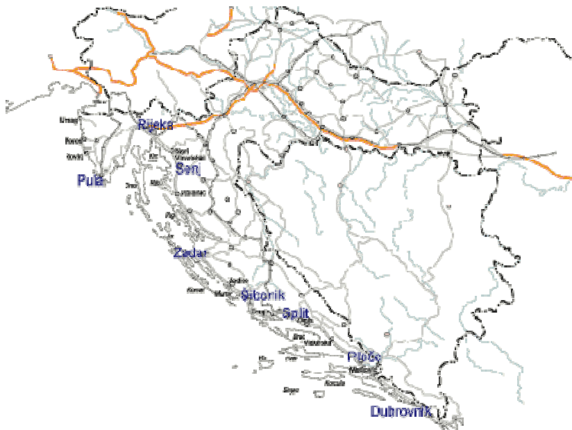
Slika 2: Lučke kapetanije Republike Hrvatske