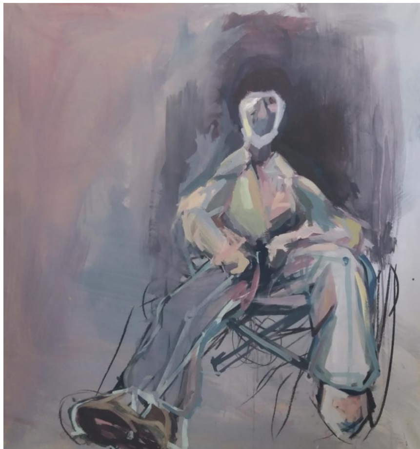
Slika broj 9

Prostor je na slici br. 9 poput maglene crnine. Noge su naslikane dosta linearno uz par blagih lazura. Noge se i ovdje proziru. Kroz hlače se naziru konstrukcijske linije koje određuju položaj nogu. Figura - osim linija napravljenih akrilom - sadrži i linije nacrtane ugljenom koje je okružuju svuda uokolo nogu i ispod stolice. Dojam neodređenosti je na taj način ponovno postignut. Lice je gotovo potpuno apstraktno. Na njemu su uočljive gotovo samo apstraktne mrlje i potezi boje koji tek u