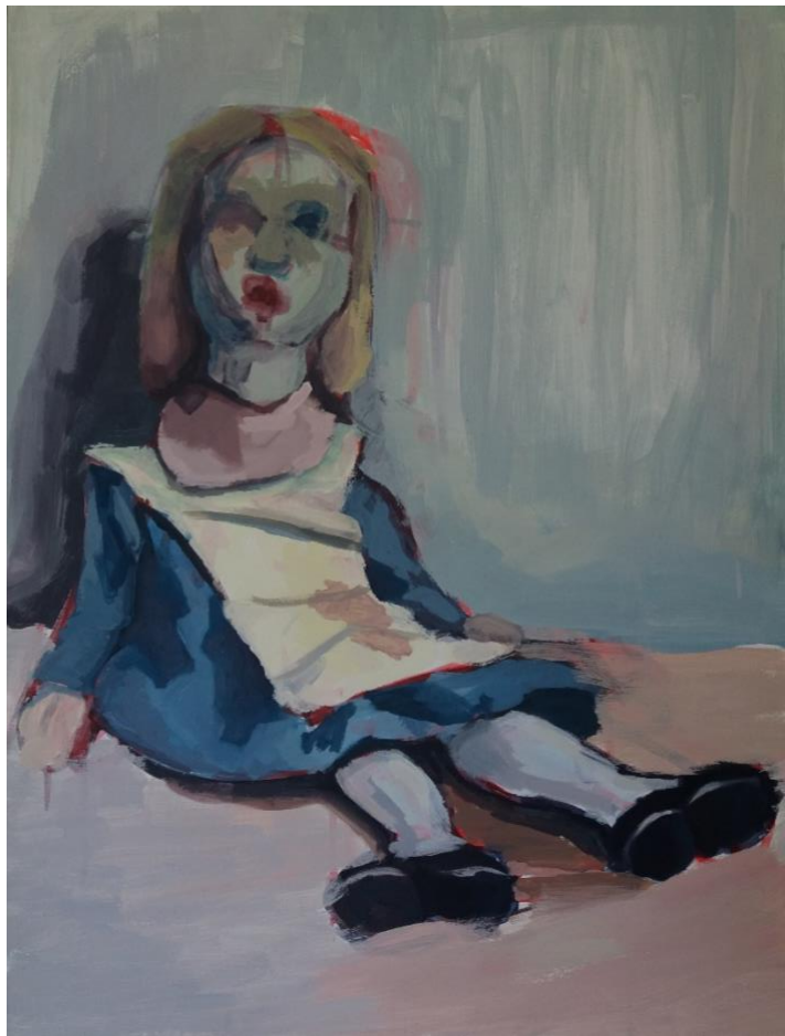
Slika broj 3

Figura na slici br. 3 sjedi beživotno zavaljena na podu podsjećajući na krpenu lutku. Iako je slikarska obrada ove figure - za razliku od prethodno opisivanih, poput duhova prozirnih figura - pretežito riješena pokrivnim slojem boje, i kod nje se očituje izvjesna bestjelesnost - figura "pati" od nedostatka kičme i kostiju uopće na što ukazuje njen položaj u mlohavoj zavaljenosti. Za razliku od postojanosti tijela, mada „neživog”, tj. njegove pokrivenosti u slikarskom smislu, lice figure je prozirno - prozire se boja pozadine kroz njega. Lice/glava se i ovdje pojavljuje poput „duha”, ili pare. Kroz cijelu figuru možemo uočiti crvenu konturnu liniju koju primjećujemo i na pozadini slike pokraj figurine glave - na to je mjesto očigledno autorica prvotno mislila postaviti glavu. Taj element jukstapozicioniranosti posebno