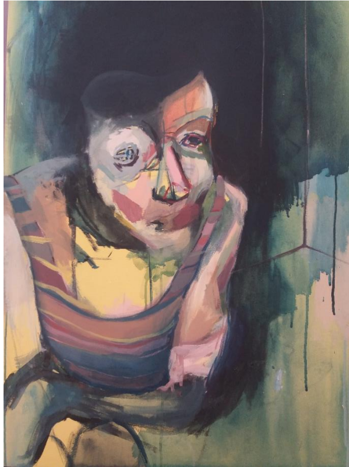
Slika broj 1

Smještaj i veličina figure u odnosu na određenje prostora nisu u skladu, miješa se više perspektiva. Prostor nije određen jedino linijama. Njega itekako određuje, više nego same linije, njegova neodređenost, nejasnoća koja se postiže velikom tamnom modrozelenom, „organskom“ plohom