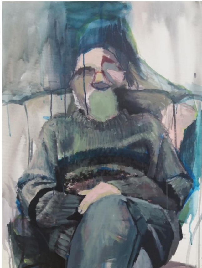
Slika broj 6

Figura i na slici br. 6 sjedi, smještena u sredinu slike i okrenuta prema promatraču, ali ne gleda u njega. Figura izgleda smireno što je postignuto njenim centralnim smještajem u format. Opet možemo uočiti odsustvo pogleda. Lijevo oko kao da je prekriveno različitim magličastim plohamo boje (jedna preko druge). Upitno je postoji li ispod tih ploha oko ili ju to samo očna duplja? Ili same te plohe predstavljaju oko? Drugo oko ima samo označenu arkadu. Lijevi obraz tj. jagodična kost je ujedno i oko. Ono na rubovima magličasto nestaje, te opet nastaje zbunjenost u vezi onoga što je uopće prikazano. Velik dio obraza nedostaje. Pitamo se nedostaju li figuri usta ili su skrivena ispod zelene plohe boje? Cijelo je čelo premalo. Obrada nosa slična je kao i na slikama br. 1, 2 i 5 - konstrukcijske linije naknadno su označene preko ploha boje. Jukstapozicioniran obris figurine glave i ovdje stvara svojevrsno ozračje, bestjelesnost figure.