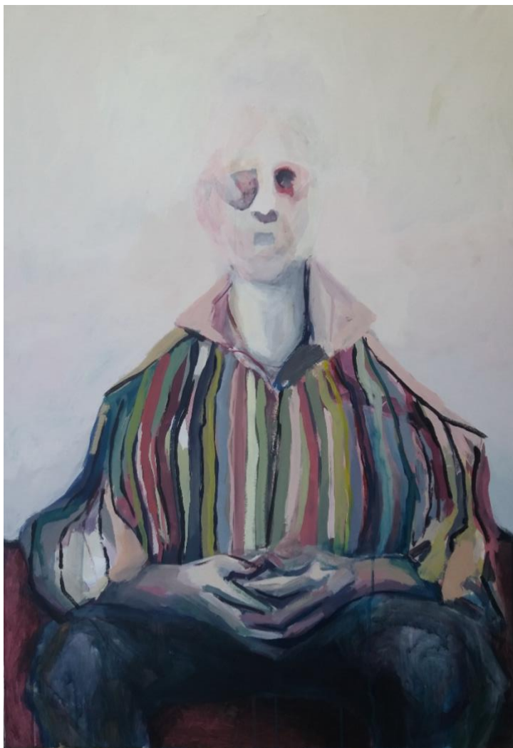
Slika broj 10

Na slici br. 10 glava se gotovo potpuno stapa s pozadinom. Figura sjedi na sofi bez naslona i ona je zapravo jedina naznaka prostora. Osim toga vidimo samo blijelu maglu u kojoj se mogu uočiti vrlo blage svijetle nijanse ružičastih, plavih i žućkastih tonova. Više nego na ijednoj drugoj slici ove serije glava opet izgleda kao para. Tijelo je zajedno sa sofom izvedeno dosta tamnim i zagasitim bojama, za razliku od svijetlih lazura kod glave. I ovdje je odjeća znatno postojanija i materijalnija od glave. Košulja je vedrih boja pa se ispostavlja kao najdominantniji i najživlji motiv na cijeloj slici. Čini se da tijelo stoji čvrsto na „zemlji“, dok glava isparava iz tijela u okolni prostor. No glava, naprotiv, unatoč svojoj „plinovitosti“, ne izgleda baš lagano. Usprkos dojma da je u bestežinskom stanju, čini se da je sva težina figure upravo u njenoj