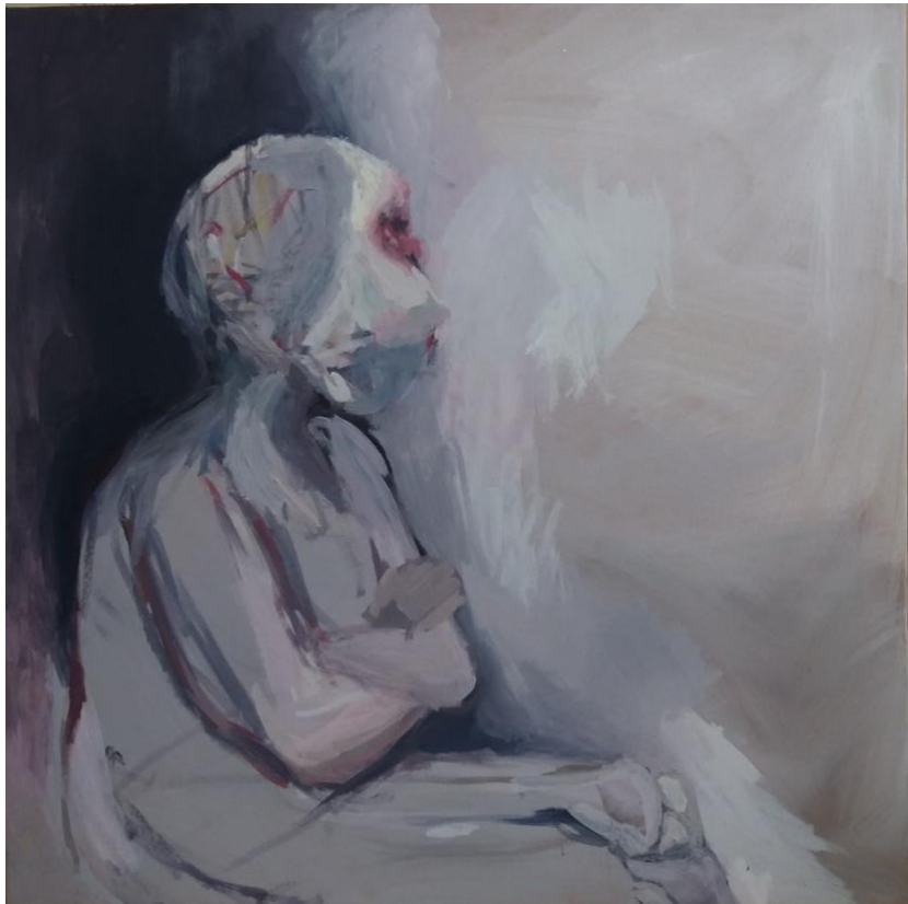
Slika broj 4

I na slici br. 4 prevladava neodređeni magličast prostor. Iza figure vidimo crninu u kojoj se dijelom očituje i figurina sjena. Figura se ovdje, na svojim rubovima, dosta strogo odjeljuje od prostora. Ona i prostor međutim i dalje su jedno iz tog razloga što je unutrašnjost figure istovjetna s podlogom (a i prostorom, jer su prostor i podloga jedno te isto). Stoga opet imamo tu šupljinu, prazninu figure. Tijelo figure čini se još praznije od samog prostora, jer na velikom dijelu tijela ne nalazimo nikakve poteze, dok su