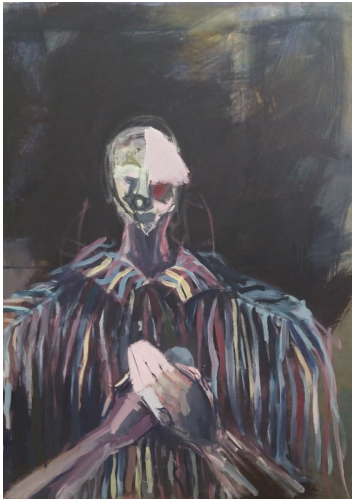
Slika broj 2

Na slici br. 2 još uočljivije nego na prethodnoj ponovno se javlja klaunovski aspekt. Ovdje opet imamo šarenilo košulje koje potencira crnilo pozadine. Na ovoj je slici prostor opet istovjetan s pozadinom - ponovno je izveden u obliku velike crne mrlje, ovog puta naslikane gušćim slojem boje ispod koje se opet nazire onaj prvi sloj pokrivne preparacije u zelenkasto-oker boji. Sama figura opet u sebi ima prozirnost, kroz nju se nazire i crnina maglastog prostora kao i ta zelenkasto-okerasta ploha same pozadine. Tako ponovno imamo dojam da figura levitira u prostoru i da prostor kroz nju prolazi. Dlanovi su ovdje dosta „teški”. Ta težina se očituje u načinu njihove obrade. Sloj boje je na njima dosta pokrivan; prostor se kroz njih ne prozire, osim u području figurine lijeve podlaktice koja je smještena pri dnu slike.