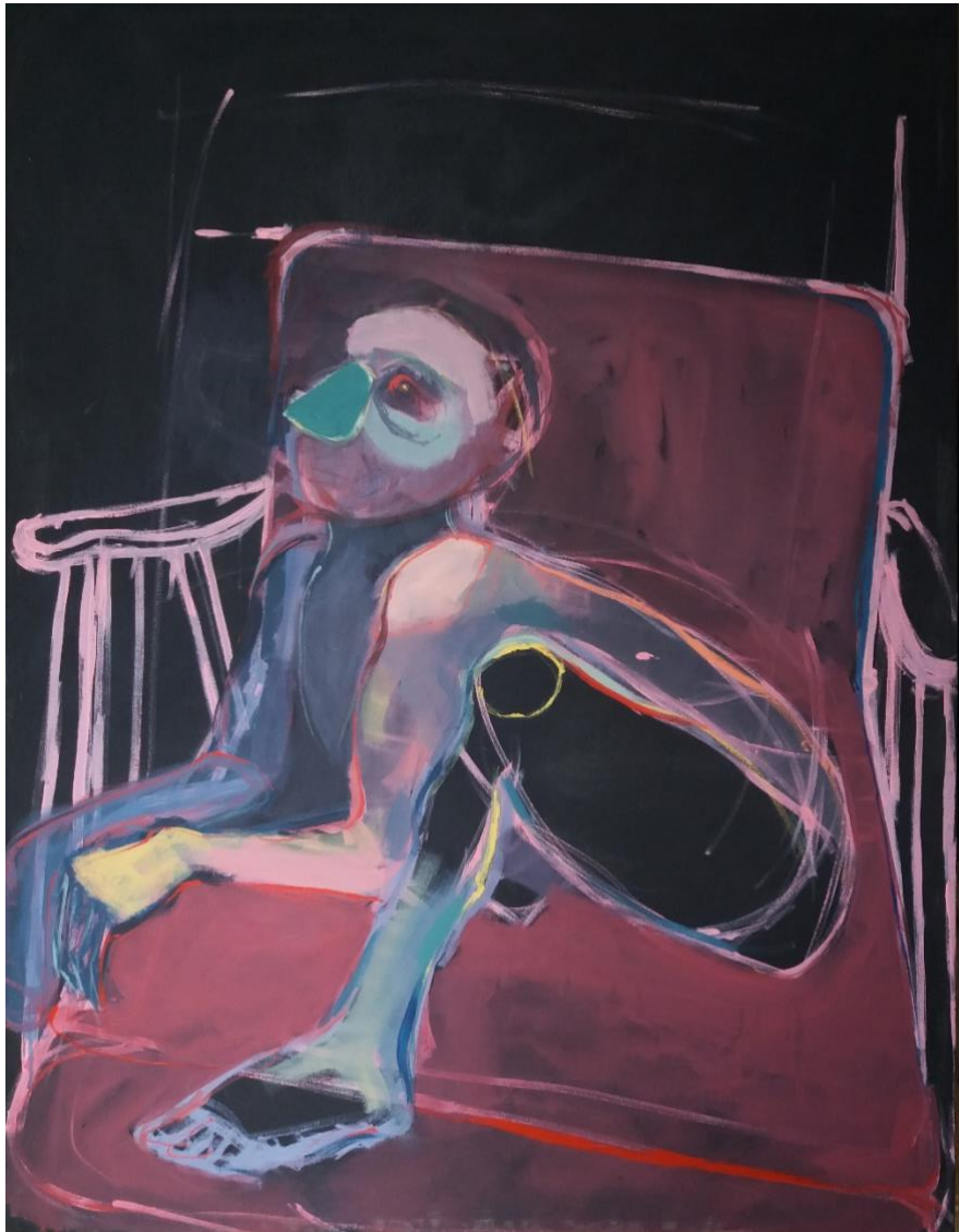
Slika broj 8

Figura na slici br. 8 sjedi na fotelji u položaju koji odgovara životinjskom dok ruke i noge prikazanog lika podsjećaju na ljudske. I njegova glava ima nešto životinjsko u sebi: umjesto usta kao da ima njušku, a na rubu glave uočava se nešto nalik životinjskom uhu. I ovdje se prostor kao i fotelja proziru kroz figuru, a prostor se prozire kroz fotelju. Prostor je naznačen jedino foteljom i njenim ručkama koje se u perspektivi približavaju točki nedogleda, a ostalo je samo crnina. Blijedo-ružičaste konture koje određuju rubove fotelje još se jednom ponavljaju iznad fotelje tako da i