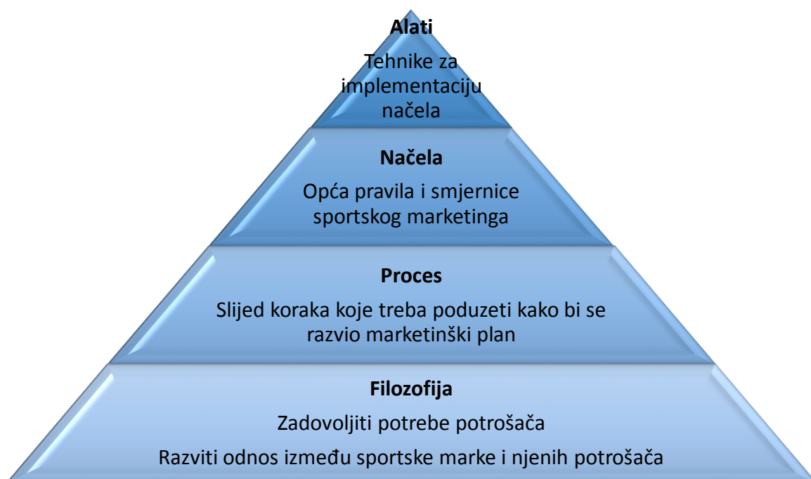
Slika 1: Struktura sportskog marketinga

Svrha sportskog marketinga, kao i marketinga općenito nadilazi pojmove osobne prodaje, promocije i oglašavanja. Suštinska bit istog je isporuka vrijednosti koja će zadovoljiti potrošačeve želje i potrebe ali i nadmašiti njegova očekivanja. Odnosno, marketing u sportu koristi principe općeg marketinga, prvenstveno na sportske proizvode i usluge poput sportskih klubova, sportskih događanja, sportske opreme te na tržišno pozicioniranje marki i sponzoriranja sportaša (Kos Kavran, Kralj, 2016.).