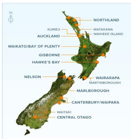
Slika 4: Prikaz lokacija najvažnijih vinskih regija na Novom Zelandu