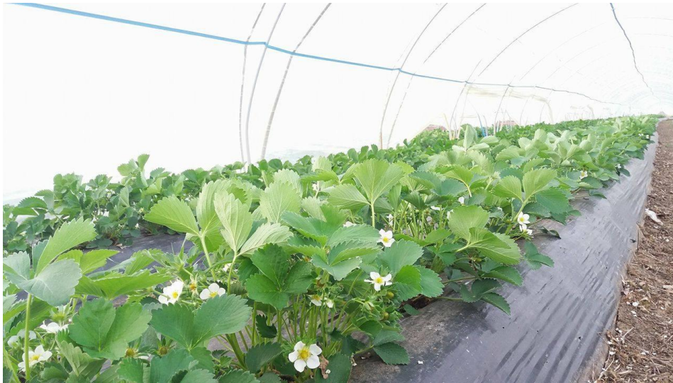
Slika 5. Jagode u cvatu

Nakon toga, u proljeće neki proizvođači svoje nasade pokrivaju agrilom ili prave na istima plastenike, da bi svoje nasade zaštitili od nevremena i leda, a samim time ubrzavaju rast biljke i ranije dozrijevanje plodova.