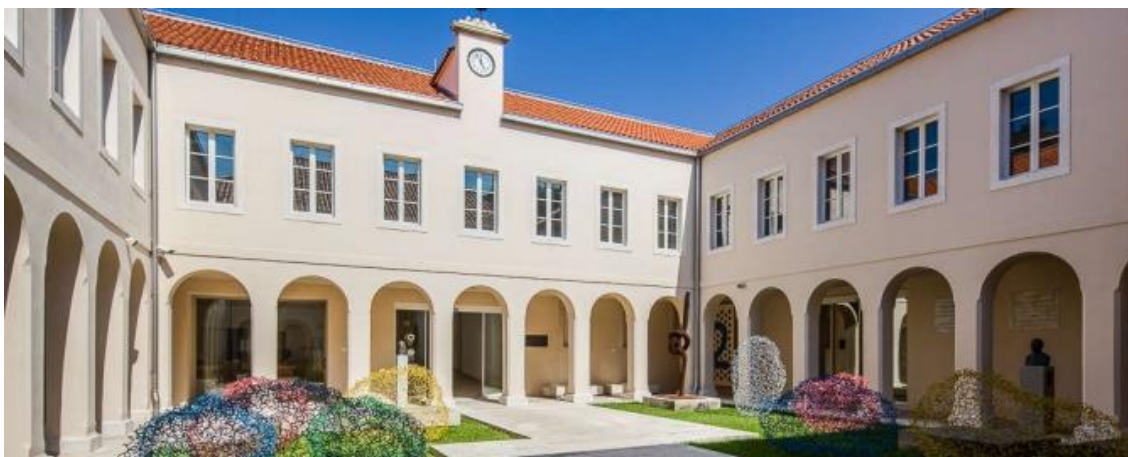
Slika 9. Galerija umjetnina Split