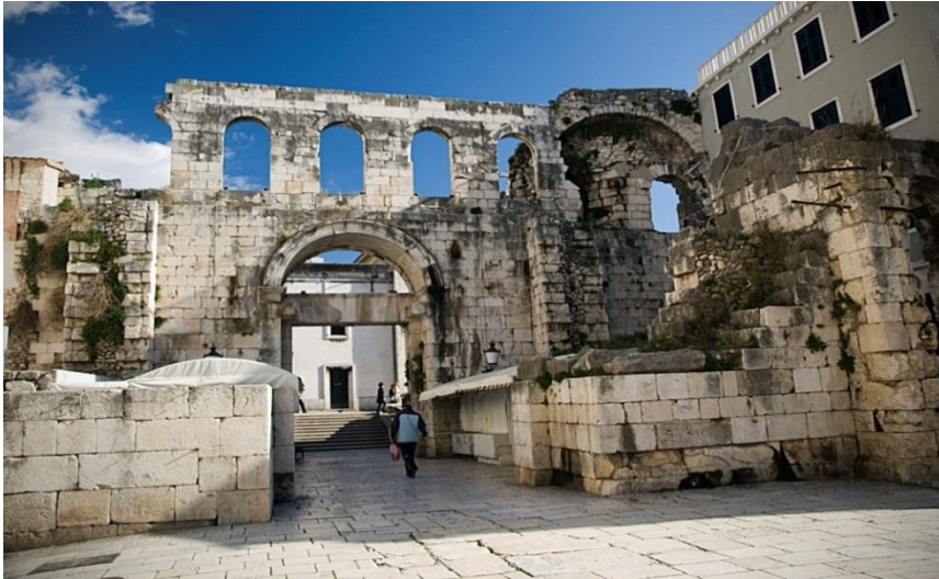
Slika 6. Srebrna vrata