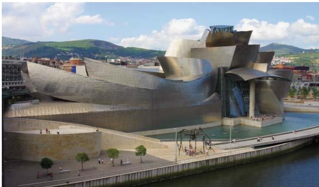
Slika 2. Muzej Guggenheim u Bilbaou