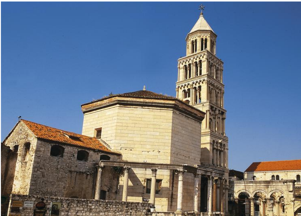
Slika 5. Dioklecijanov mauzolej (Katedrala sv. Dujma)