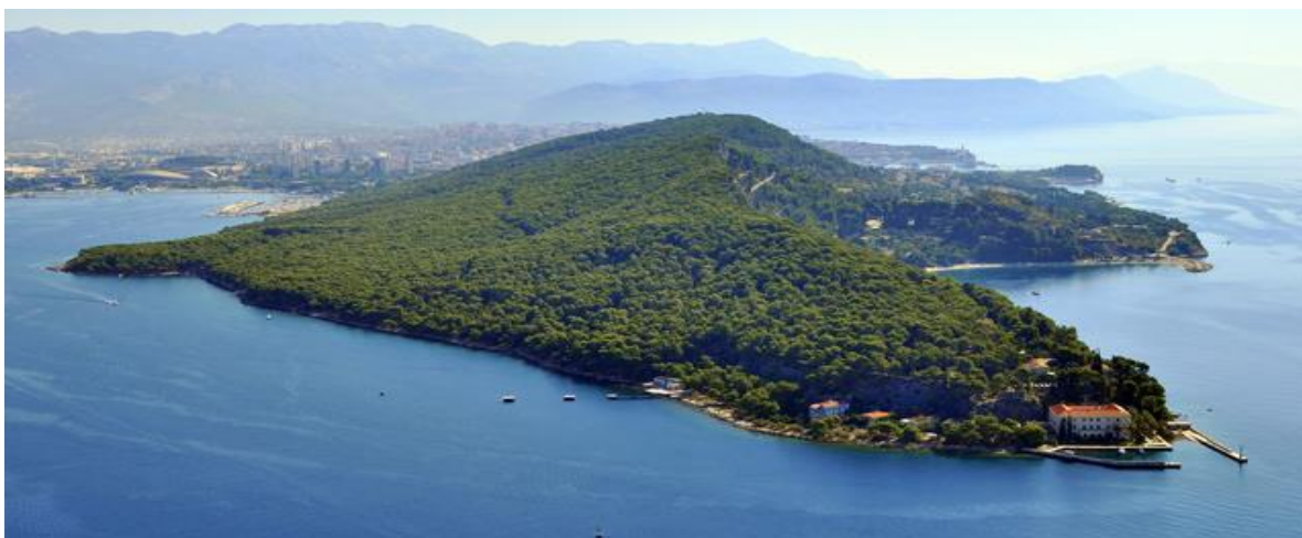
Slika 15. Park-šuma Marjan