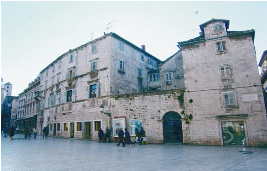
Slika 13. Kuća Pavlović na Pjaci