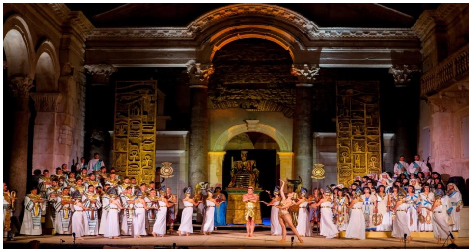
Slika 16. Splitsko ljeto 2015.godine – izvedba 'Aide' na Peristilu