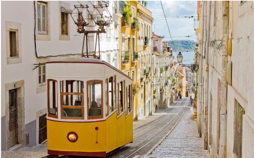
Slika 11. Tramvaj – jedan od najprepoznatljivijih gradskih simbola, Lisabon