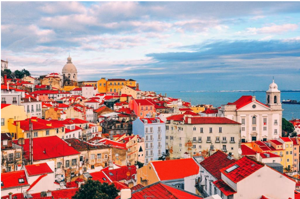
Slika 9. Lisabon

Lisabon je glavni grad Portugala. Lisabon je mnogo više od središta povijesti i kulture. To je drugi najstariji glavni grad u Europi (nakon Atene), koji je nekada bio dom najvećih svjetskih istraživača poput Vasco da Gama, Magellana i kneza Henryja Navigatora, postajući prvi pravi svjetski grad. Proizvod je mješavine ljudi, tradicija, filozofija i uvjerenja (Go Lisbon, http://www.golisbon.com/ ). Ovdje žive jedni od najsrdanijih ljudi koji će vas primiti raširenih ruku. Poznat kao "grad na sedam brežuljaka", Lisabon postaje sve dostupniji grad uklanjanjem arhitektonskih i neujednačenih barijera. Uvođenje novih popločenja, rampa i prikladne signalizacije stvorilo je uvjete koji olakšavaju kretanje hendikepiranim osobama i omogućilo je svima da uživaju u javnim prostorima, omogućujući im da se kreću samostalno. Važno je naglasiti kako je i jedna od najsigurnijih europskih metropola.