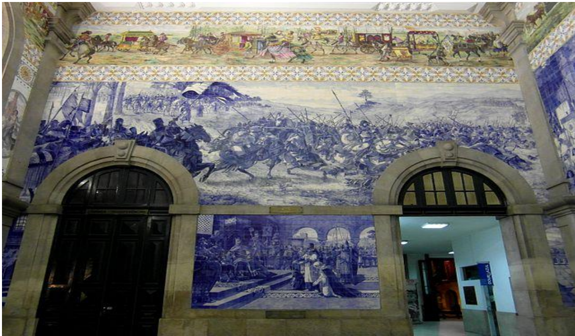
Slika 3. Unutrašnjost željezničkog kolodvora São Bento

Gaia strani, gdje se nalaze vinski podrumi, uvršteni su na popis svjetske baštine. Željeznički kolodvor S. Bento poznat je po atriju obloženim pločicama koje prikazuju povijest Portugala. Ribeira je najstarija četvrt grada ispunjena starim kućama, uskim kamenim ulicama i brojnim obiteljskim restoranima, kafićima i barovima. Marine i dokovi Ribeirie prihvaćaju turističke i druge brodove, a na moru su mogući razni vodeni sportovi poput jedrenja, veslanja, kanuinga, ronjenja, surfanja i skijanja na vodi. Arhitektonski impozantna Casa da Música (Kuća glazbe) sa svojom odvažnom arhitekturom, osmišljena je kako bi ugostila sve vrste glazbe; od klasične do elektronske, jazza, fada, velikih međunarodnih produkcija do malih eksperimentalnih projekata. Turisti često posjećuju i katedralu (12.st.) prepoznatljivu po svoja dva tornja. Tijekom godina prošla je razne izmjene, a najvažnije su gotički prozor (rozeta), visoki oltar te rokoko vrata. Ckva sv. Franje (14.st), interijer je prekriven baroknim i rokoko pozlaćenim drvenim rezbarijama.