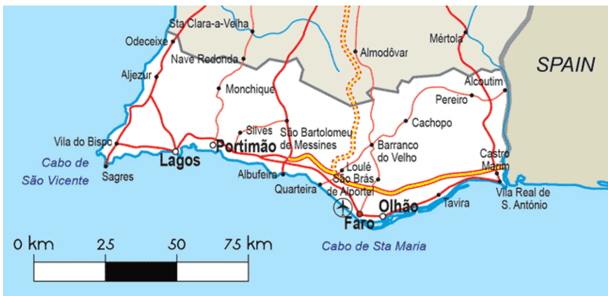
Slika 14. Karta regije Algarve

za nekoliko dana na plaži i zimi za opustiti se ili uključiti u razne aktivnosti. Golf je donio u Algarve mnoge međunarodne nagrade i priznanja, a regija je više puta proglašena najboljim golf odredištem u svijetu. Algarve ima oko četrdeset terena s odličnim uvjetima za iskusne igrače i za početnike. Priroda se najbolje odražava u tri Nacionalna parka : NP St Vincent, ovaj park prirode je najdulji segment zaštićene obale u Portugalu, koji pokriva površinu od 76.000 hektara; NP Ria Formosa je jedinstveni laguna sustav (močvare, otočići, dine, solane, lagune sa svježom vodom, zemljišta itd.), a simbol parka je ptica sultanka; te NP Močvarno tlo Castro Marim i Vila Real de Santo António. Postoje i mogućnosti za razne sportove poput: parasailinga, ronjenja, letenja zmajem itd. Baštinu Algarve je lako vidjeti kako se putuje kroz regiju. Karakterističan manuelinski stil arhitekture bio je raskošan i religiozan, s visokim stropovima i široki lukovima, istaknute nautičke teme i izmišljenia bića inspirirana pričama o Novom svijetu. Tradicionalni zanati poput korparstva, tkanja i izrade čipke su preživjeli uglavnom zbog razvoja turizma. Algarve voli slaviti svoju prošlost s različitim festivalima i karnevalima, te su oni jedna od glavnih atrakcija za turiste. Stanovnici ulažu puno vremena i truda u događaje, kako bi privukli što više turista.