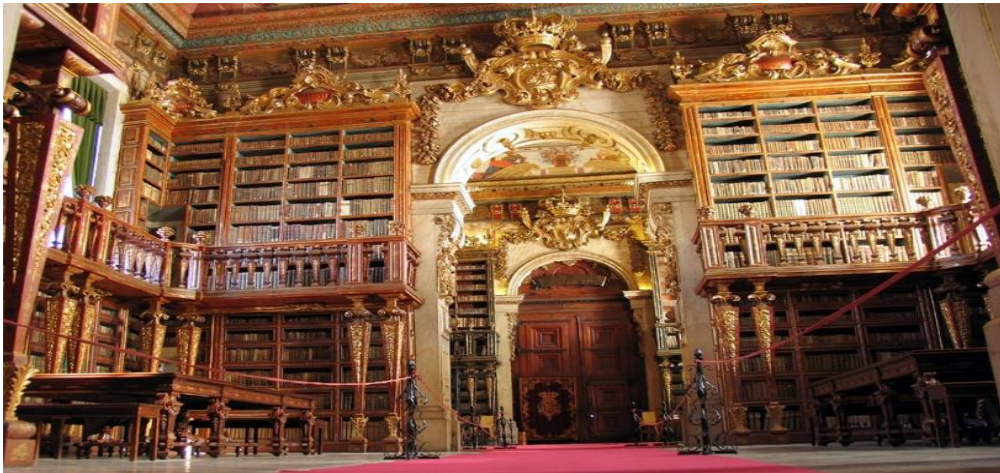
Slika 6. Joanine knjižnica

Joanine knjižnica koja ima više od 300000 radova iz 16. do 18. stoljeća koji su raspoređeni u prekrasnim pozlaćenim policama. Zgrade zauzimaju mjesto palače u kojoj su živjeli prvi kraljevi Portugala, kada su grad proglasili glavnim gradom kraljevstva (Visit Portugal, https://www.visitportugal.com/ ).