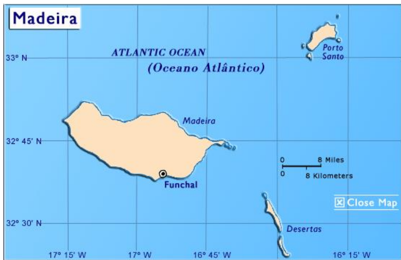
Slika 17. Karta otočja Madeira