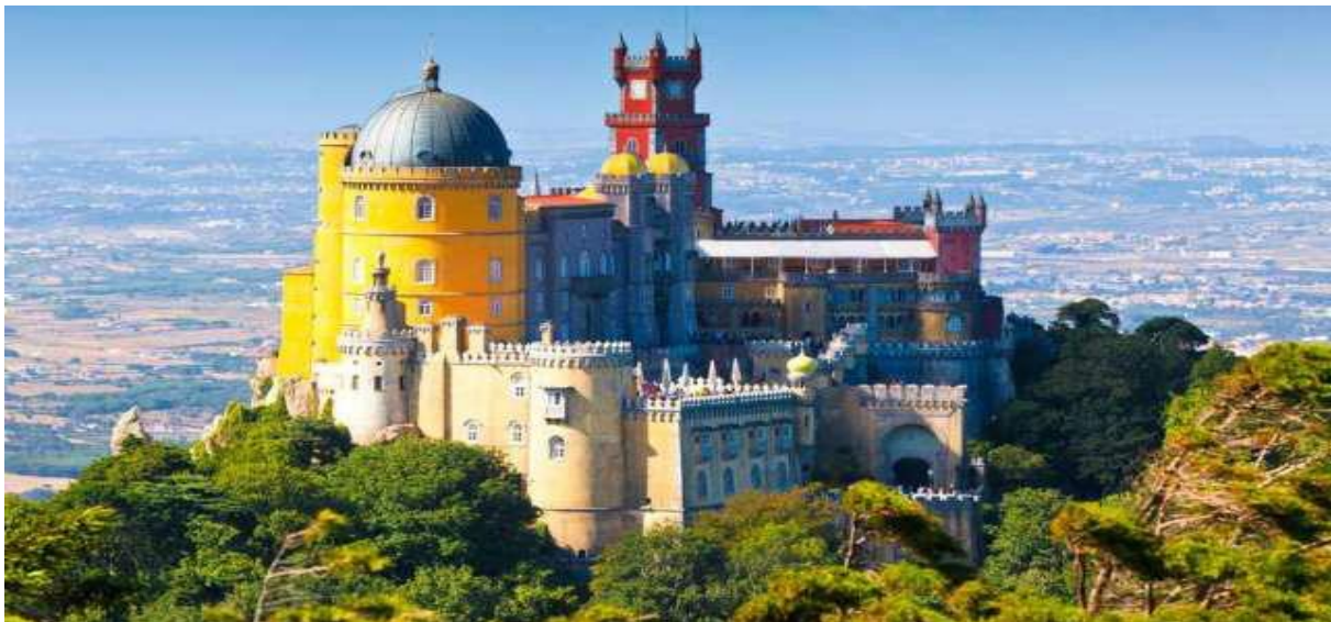
Slika 12. Palača Pena, Sintra