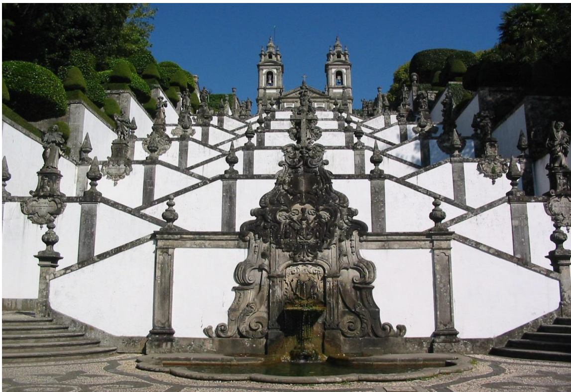
Slika 4. Crkva Bom Jesus do Monte i stubište

te Muzej Tesouro da Sé. U crkvi Bom Jesus do Monte (19.st.); nalazi se stubište koje vodi do vrha sadrži 17 odmorišta ukrašenih simboličnim fontanama, alegorijskim kipovima i drugim baroknim stilskim ukrasima uz teme kao što su Postaje križa, Pet osjetila, Vrline, Mojsije prima zapovijedi, a na vrhu osam biblijskih figura koje su pridonijele Isusovoj osudi. Od suvremenih znamenitosti ističe se gradski stadion Braga, kojeg je dizajnirao Souto Moura, izgrađen je za Euro 2004. godine (Visit Portugal, https://www.visitportugal.com/en/ ). S obzirom na činjenicu da Braga ima gotovo četrdeset mjesta bogoslužja, lako je vidjeti zašto je ovaj barokni grad, poznat kao čvrsta, destinacija vjerskog turizma. Zahvaljujući velikom broju studenata i stalanom priljevu mladih portugalaca, Braga ima neke živahne kulturne ponude, uglavnom podzemnu bar scenu. Dodatnu avanturu na otvorenom u neposrednoj blizini - nacionalni park Gerês. Bragin lagani ritam života ubrzava se poslije mraka, osobito u središtu grada. Poput mnogih sveučilišnih gradova, Braga ima kreativnu energiju koja okuplja sve vrste ljudi, nadilazeći dob, klasu i životni stil.