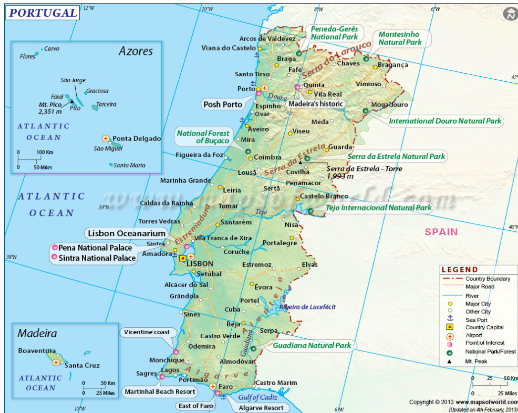
Slika 1. Karta Portugala