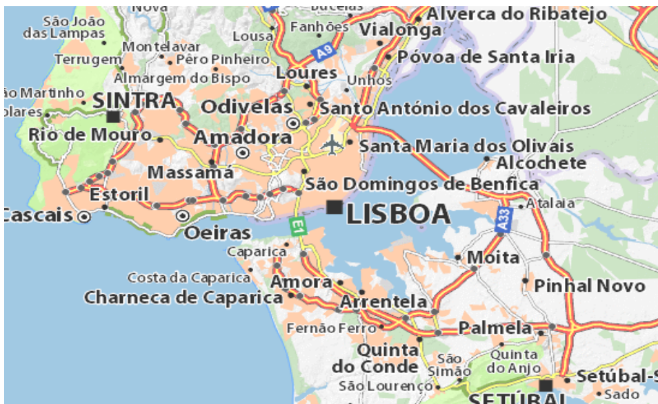
Slika 8. Karta Lisabona i okolice

Središnji fokus ove regije je Tagus, najveća rijeka na Iberijskom poluotoku. Lisabon je europski glavni grad koji se nalazi na ušću Tagusa. Setubal poluotok nalazi se na ušću rijeka Tagus i Sado. Njegova okolina nudi nevjerojatnu raznolikost turističkih atrakcija, od bajkovitih palača u jednom od najromantičnijih europskih gradova (Sintra), do svjetske klase golfa i zabave u najvećem europskom casinu u Estorilu, surfanja u Cascaisu ili bijeg u park prirode u Arrábidi, te promatranje dupina u Setúbalu. Na sjeveru Lisabona nalazi se "salioia" (ruralno) područje, portugalska Estremadura koja je ispunjena liticama, plažama i zanimljivim malim gradovima. Lokalno gospodarstvo sastoji se od poljoprivrednih i uslužnih djelatnosti. Obala oko Lisabona pruža savršene uvjete za vodene sportove kao što su surfanje i jedrenje na dasci (Jackson i Hudman, 2014:298). Zračna luka u Lisabonu je povezana dobro razvijenom cestovnom i željezničkom mrežom koja povezuje zračnu luku s ostatkom zemlje. Ono što mnogi ljudi ne zna je da je prosječna godišnja količina padalina u Lisabonu ista kao u Londonu. Jedina razlika je u tome što u Londonu kiša pada tijekom cijele godine, a u Lisabonu je to samo ponekad. Široka raznolikost krajolika i baštine uvijek je blizu, bilo na sjeveru ili južnoj strani glavnog grada. Uz obalnu cestu pronaći ćete plaže i odmarališta koja kombiniraju vile i hotele s početka 20. stoljeća s marinama, terasama i odličnim golf igralištima.