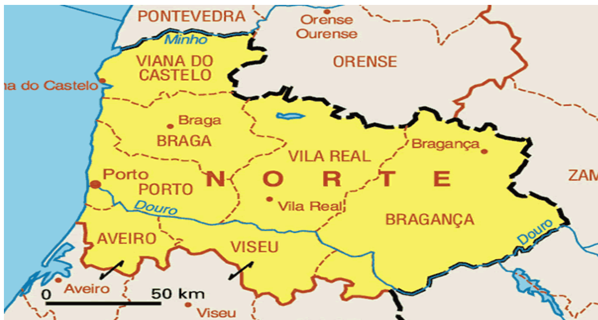
Slika 2. Karta Sjeverne regije

Sjeverna regija Portugala se može pohvaliti bogatom kulturnom i povijesnom baštinom. Ovo je područje koljevka suvremenog Portugala, koji je ovdje osnovan u 12. stoljeću. Tu se nalaze brojne plaže gdje je morska voda hladnija nego u ostatku zemlje. Ribolov na otvorenom moru, surfanje i daskanje su glavne aktivnosti. Golf je jedna od glavnih atrakcija sjeverne regije, te se na tom području nalazi 11 terena. Jedna od zanimljivosti koje se mogu posjetiti je Arouca geopark, to je područje nekada bilo pod vodom, dom za brojne tajanstvene, gigantske životinje iz razdoblja paleozoika. Danas se u njemu nalaze fosili. U njemu se nalazi 41 geološka znamenitost. Sjeverna regija Portugala iznenađuje prekrasnim krajolicima, planinama, visoravnima, dolinama i bogatom florom i faunom. Prirodu karakterizira raznolikost prirodnih resursa i zaštićena prirodna područja, kao što je Nacionalni park Peneda Gerês (Boniface i Cooper, 2016:321).