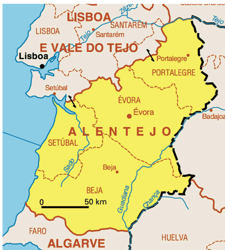
Slika 13. Karta regije Alentejo