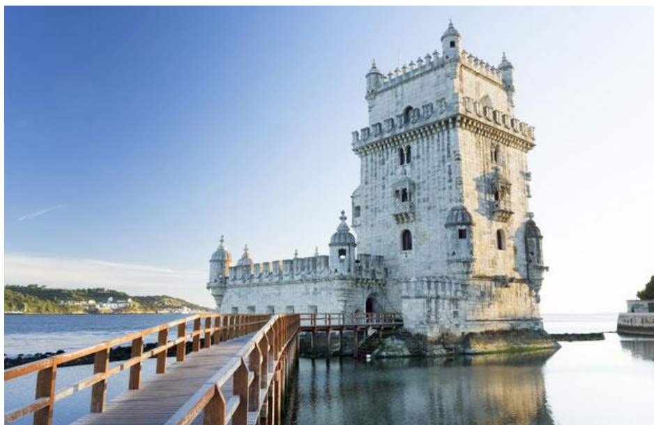
Slika 10. Kula Belém, Lisabon