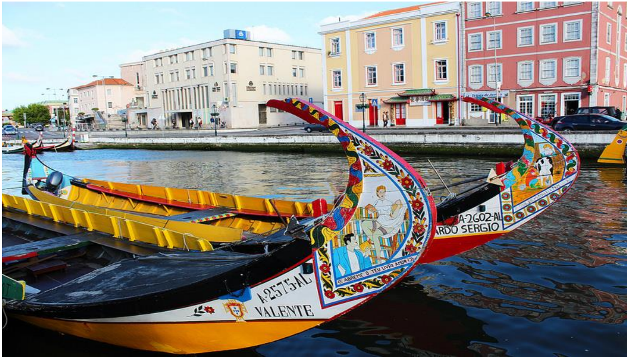
Slika 7. Moliceiros (lokalni brodovi), Aveiro