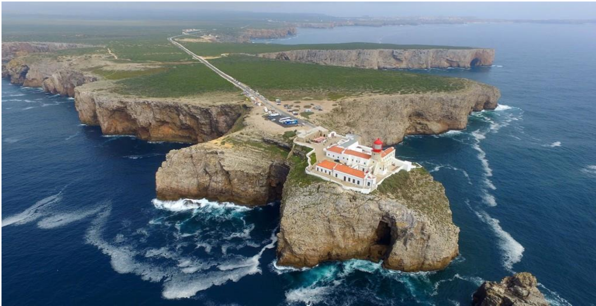
Slika 15. Rt Svetog Vincenta, Sagres

Sagres je savršen za biciklizam, jedrenje na dasci, ronjenje i općenito da se doživi Algarve koja još uvijek nije pod utjecajem turizma. Surfanje je glavna aktivnost Sagresa, ali ima i izazovne pješačke staze, a udaljavanjem od luke ribarstvo (Sagres uncovered, http://www.sagresuncovered.com/ ).