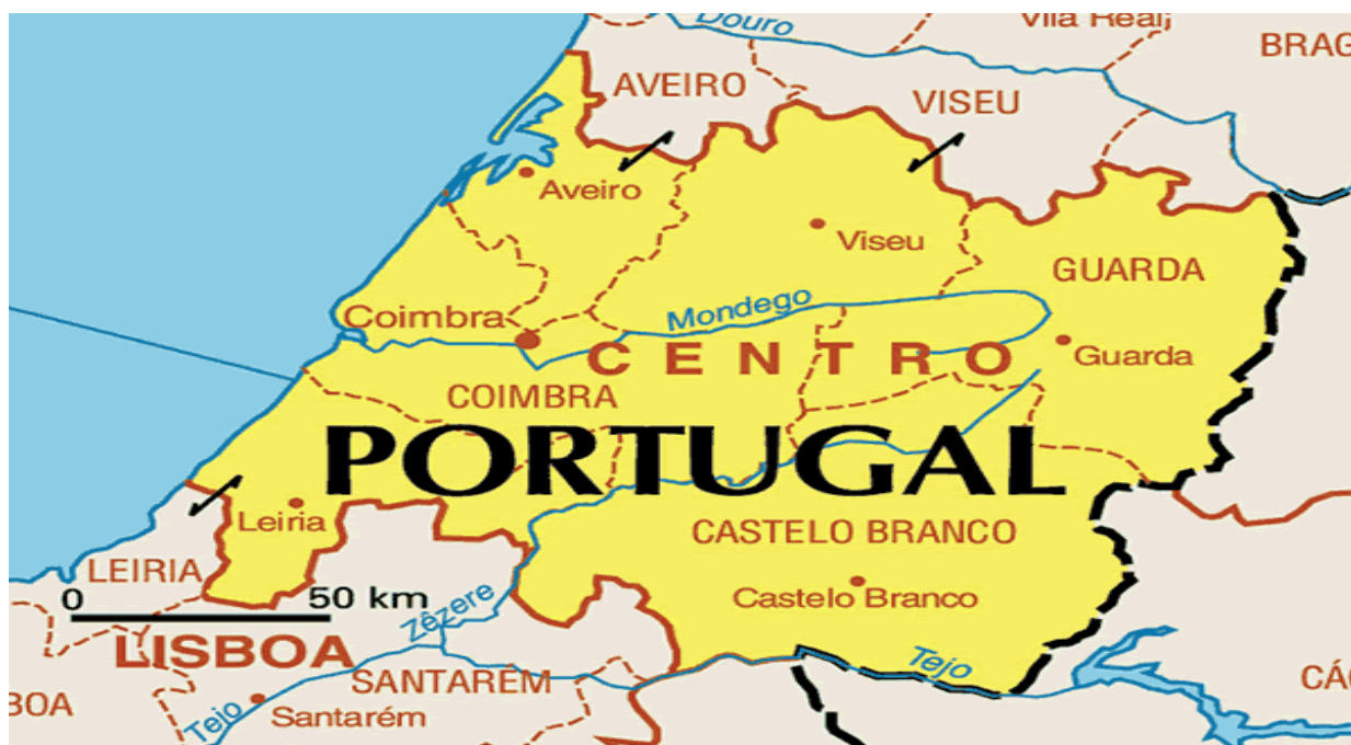
Slika 5. Karta regije Središnji Portugal