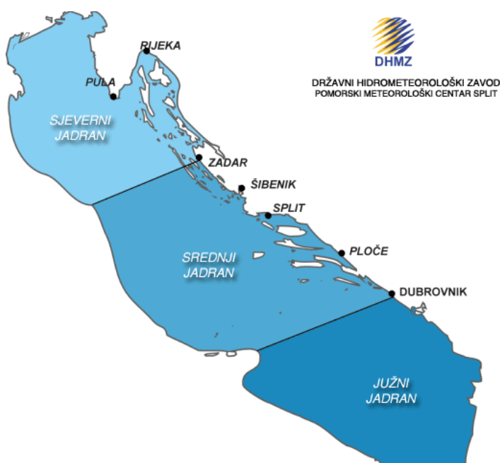
Slika 1: Geografska podjela Jadrana (DHMZ, 2017.)

More i obalni prostor najznačajniji su prirodno- geografski elementi za razvoj nautičkog turizma. Pritom, prirodno- resursnu osnovu razvitka nautičkog turizma čine (Dulčić, 2002.): prirodno- geomorfološke forme, kao reljef priobalnog prostora, hidrografske elementi, odnosno fizička, termalna i kemijska svojstva vode i klimatske osobine podneblja (temperatura zraka, oborine, vjetrovi, sunčanost/oblačnost i vlažnost zraka). Srednji Jadran, prema podjeli Državnog hidrometeorološkog zavoda obuhvaća područje od Zadra do Dubrovnika, te uključuje četiri županije: Zadarsku županiju, Šibensko- kninsku županiju, Splitsko- dalmatinsku županiju, te Dubrovačko- neretvansku županiju.