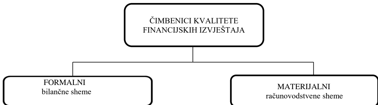
Slika 3. Čimbenici kvalitete financijskih izvještaja

Formalni sadržaj temelji se na sam oblik izvještaja. On se najčešće javlja putem predloženih ili propisanih bilančnih shema. Materijalni određuje vrijednost pozicija u već unaprijed određenim bilančnim shemama. S ovim informacijama dolazi se do zaključka da : „računovodstvene politike čine temeljnu komponentu kvalitete financijskih izvještaja“. 11