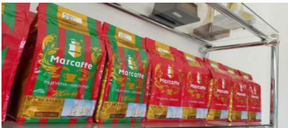
Slika br. 8: Marcaffè mljevena kava 500g (crveno i zeleno “tradicionalno” pakiranje)