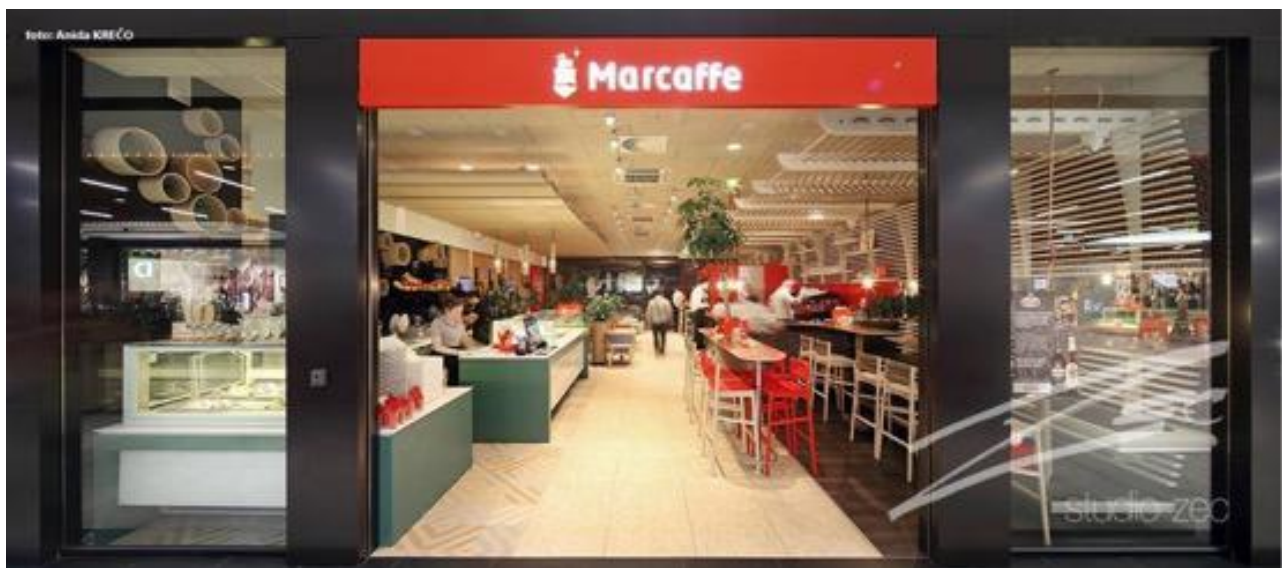
Slika br. 14: Marcaffè CoffeeShop Tuzla

Djelatnosti kojima se poduzeće bavi su primarno prodaja kave te prodaja instant napitaka. Pored toga, velik dio posla radi se i sa samouslužnim aparatim. Poduzeće snabdijeva kafiće, restorane i ostale uslužne objekte kojima daje svoje aparate za kavu, mlinove te reklamnu opremu. Proširenje djelatnosti dogodilo se unazad par godina kada je poduzeće otvorilo prvi kafić u Sarajevu, glavnom gradu Bosne i Hercegovine. Nakon njega uslijedilo je otvaranje istih u Tuzli te nakon toga i u Travniku. Svaki od ovih kafića nudi gostima mogućnost kupovine svih proizvoda u njima.