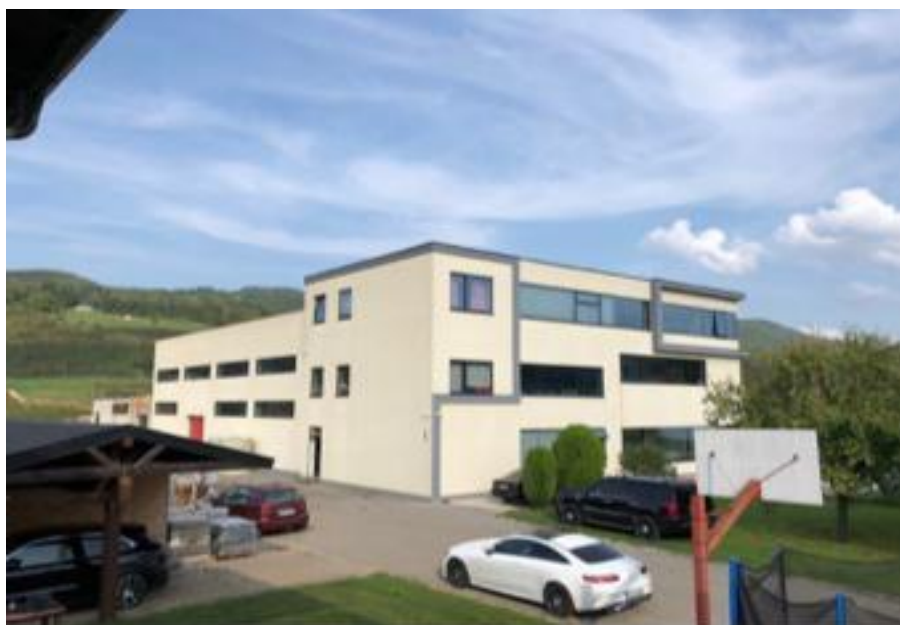
Slika br. 7: Marcaffé tvornica danas