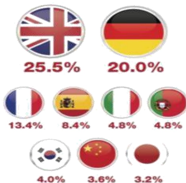
Slika br. 2: Prikaz zastupljenosti svjetskih jezika u obiteljskim poduzećima