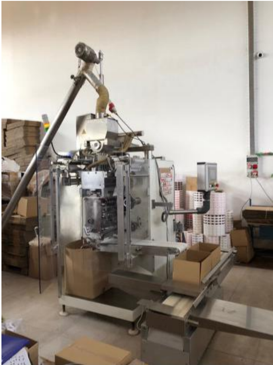
Slika br. 13: Stroj za pakiranje šećera

Osim najnovije opreme za pakovanje kave, tu su pakerice za pakovanje šećera kao i jedna od tehnološki najnaprednijih pakerica za instant napitke firme “Schmucker”.