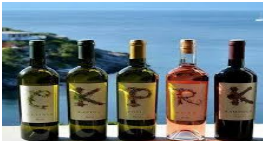
Slika 8: vina vinarije Bačić

Petar smatra da je na otoku pogodno za proizvodnju vina jer je vino proizvod koji je cijenjen u svijetu, s vremenom će poslovanje možda postati teže zbog velike konkurencije ali ujedno lakše zbog razijanja elitnog turizma sve je veći broj restorana koji traže vrhunska vina za strane i domaće goste. Ovakva vrsta turizma kako Petar kaže uvelike će im olakšati brendiranje proizvoda i jačanje tržišne cijene.