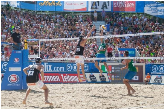
Slika 3 : Beach volleyball major Poreč series