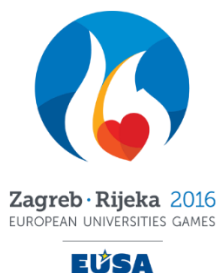
Slika 4 : Europske sveučilišne igre Zagreb – Rijeka, 2016