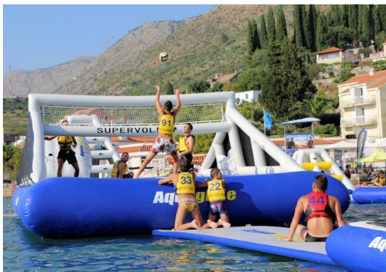
Slika 14 : Odbojka na trampolinu