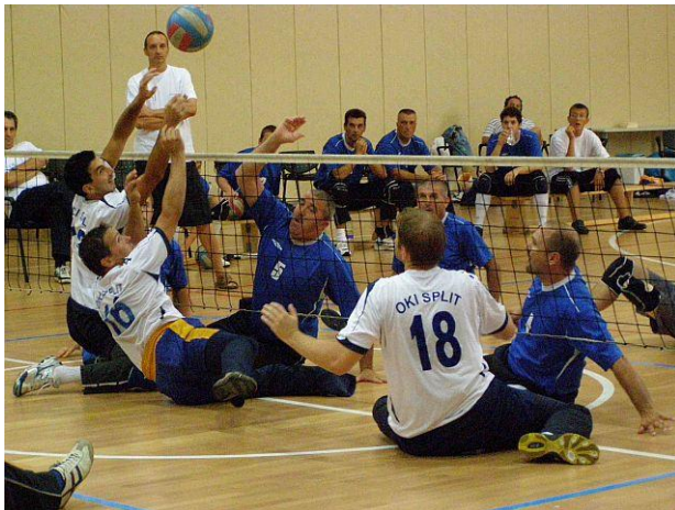
Slika 12: Detalj s utakmice Zadar - Split