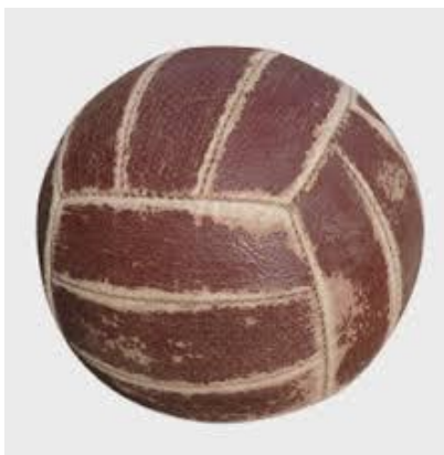
Slika 8 : Prva odbojkaška lopta