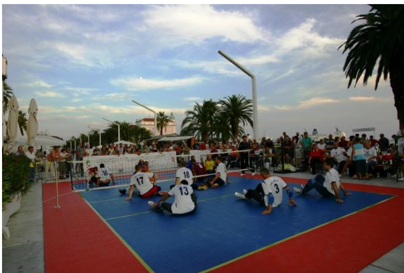
Slika 13: Odbojkaški klub invalida Split na Rivi