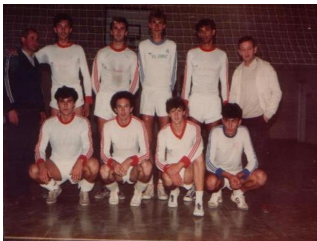
Slika 9: Momčad Mladosti 1987.godine