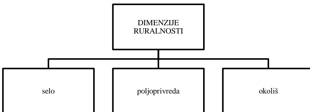
Slika 1. Dimenzije ruralnosti

Ruralnost sadrži tri dimenzije (Slika 1).