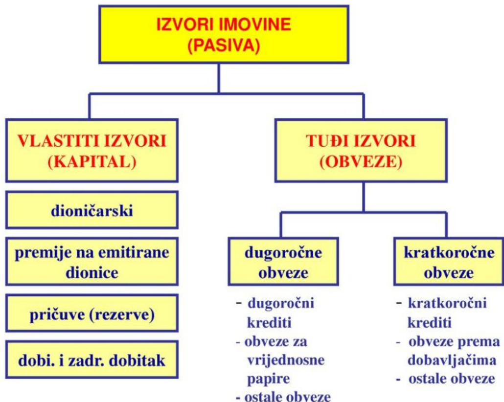
Slika 3: Detaljni prikaz podjele pasive