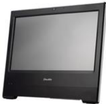
Slika 5: Shuttle X50v6