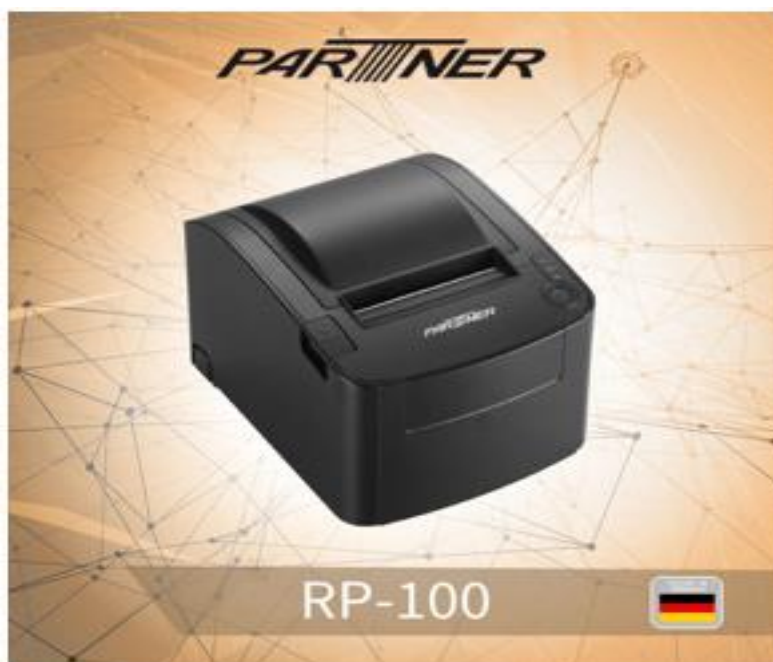
Slika 6: Termalni pisač PartnerTech RP-100