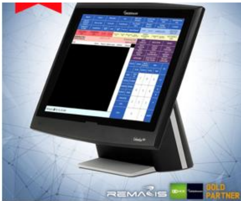
Slika 4: Orderman Columbus 900