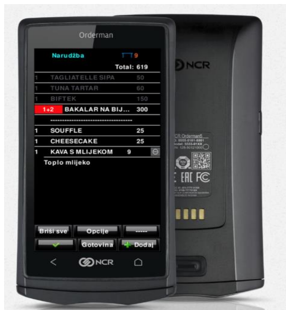
Slika 1: NCR Orderman 5