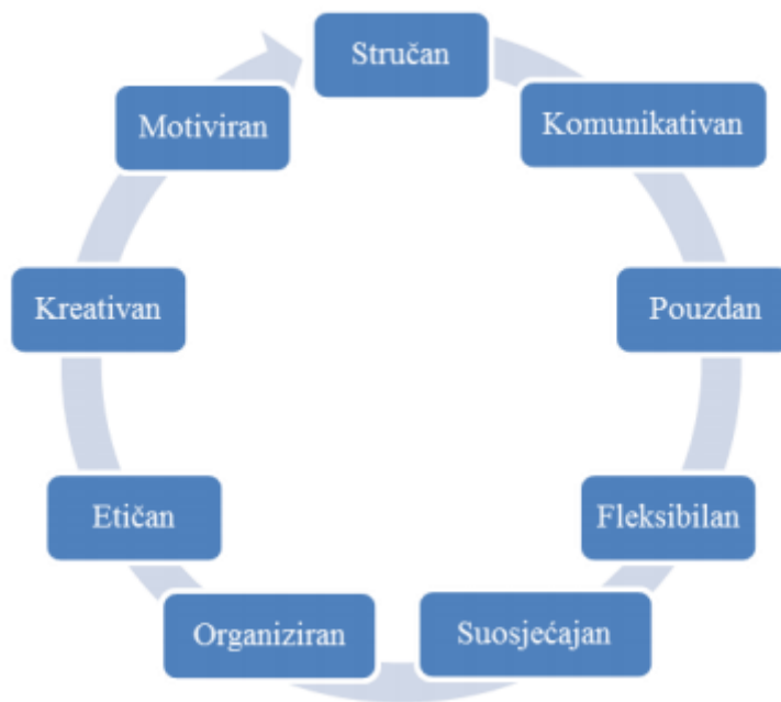
Slika 1. Zajedničke karakteristike uspješnih prodavača

Izvor: Tomašević-Lišanin, M. (2010): Profesionalna prodaja i pregovaranje, HUPUP, Zagreb, str.25.