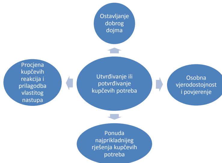
Slika 3. Sve faze prodajnog procesa moraju biti određene na način koji podržava stvaranje i održavanje međusobnog povjerenja