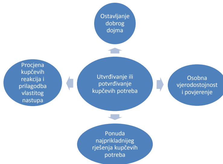
Slika 3. Sve faze prodajnog procesa moraju biti određene na način koji podržava stvaranje i održavanje međusobnog povjerenja