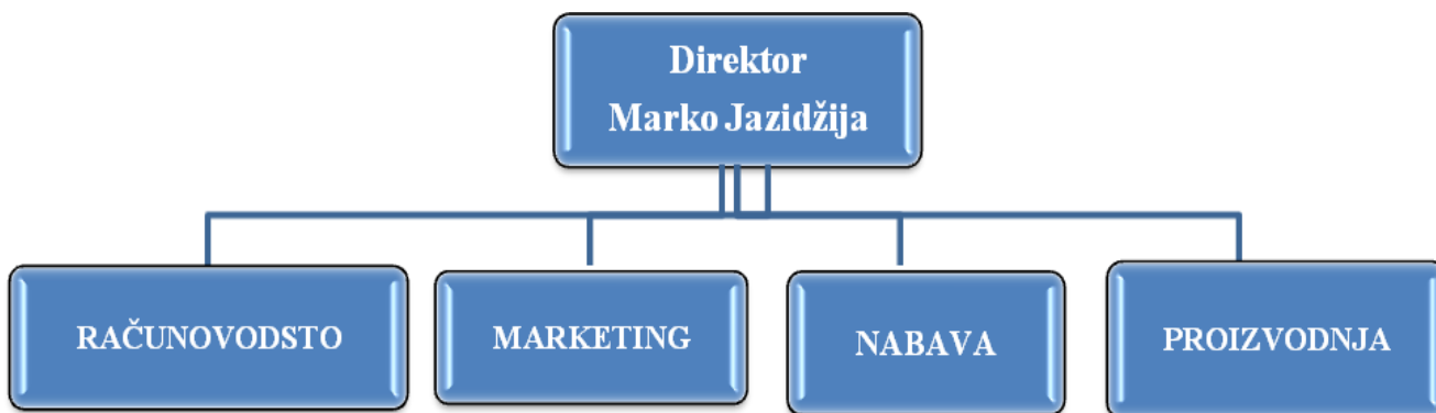
Slika 2: Organizacijska struktura poduzeća „Naprijed“ d.o.o.

U tablici broj 2 prikazani su točni podaci o broju radnika u poduzeću „Naprijed“ d.o.o i o njihovom smještaju u ovisnosti o zadacima rada.