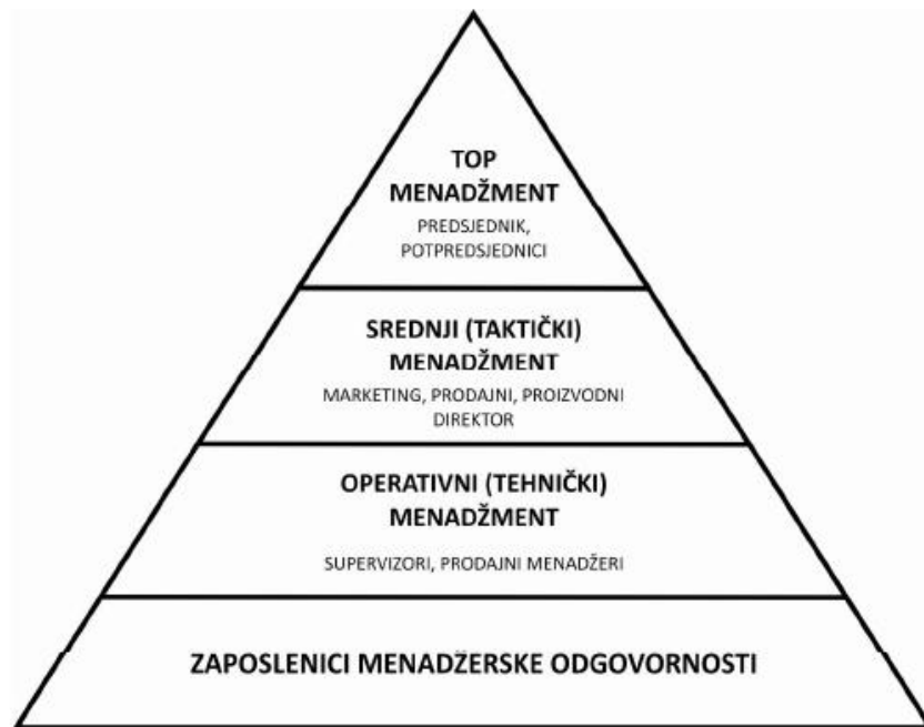
Slika 2. Razine menadžerske odgovornosti