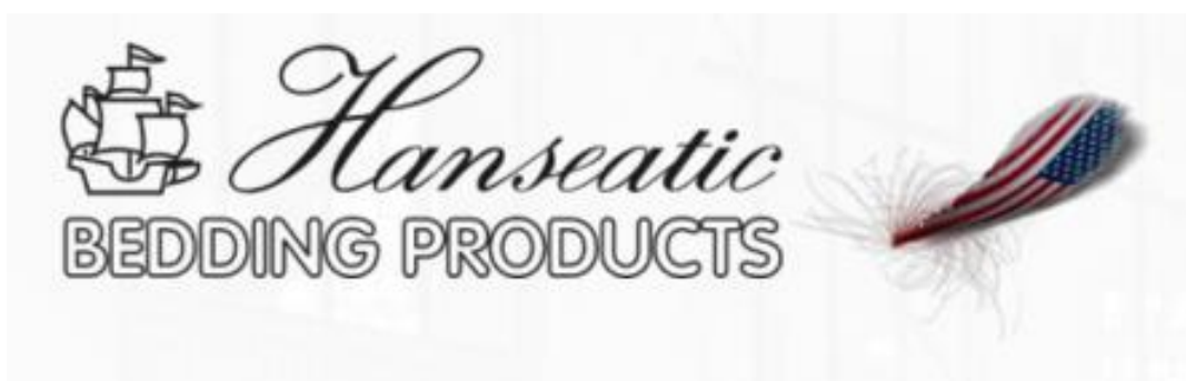
Slika 4. Logo tvrtke Hanseatic bedding products

U Splitu, 2016. god registriran je novi obrt za posredovanje u trgovini raznovrsnim proizvodima. Mnogima nepoznato ali ovaj novi obrt na ovim područjima ima svoju dugu povijest i velike uspijhe diljem svijeta. Delmatium je podružnica velikog Hanseatic brenda, rade proizvode koja je posvećena pružanju najbolje u klasi posteljine. To je podružnica RIBECO grupe tvrtki (RBC), koja je osnovana 1917. Godine. Danas je RBC najveći europski proizvođač i dobavljač posteljine i posteljine u maloprodaji i ugostiteljstvu. Tvrtka ima svoje proizvodne pogone u Njemačkoj i Kini, licenciranu proizvodnju u Brazilu i Kolumbiji, kao i pristup proizvodnji u SAD-u i Južnoj Africi.