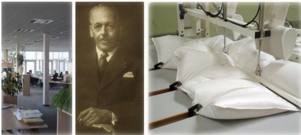
Slika 5. Hanseatic Brend