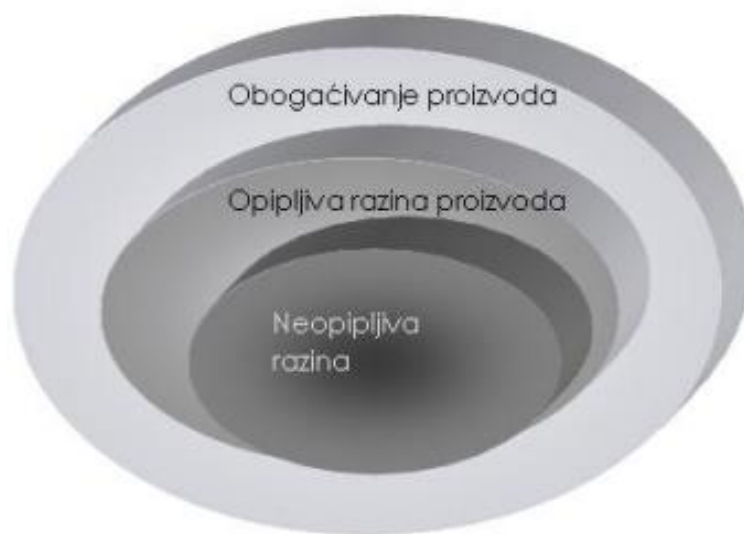
Slika 1. Tri