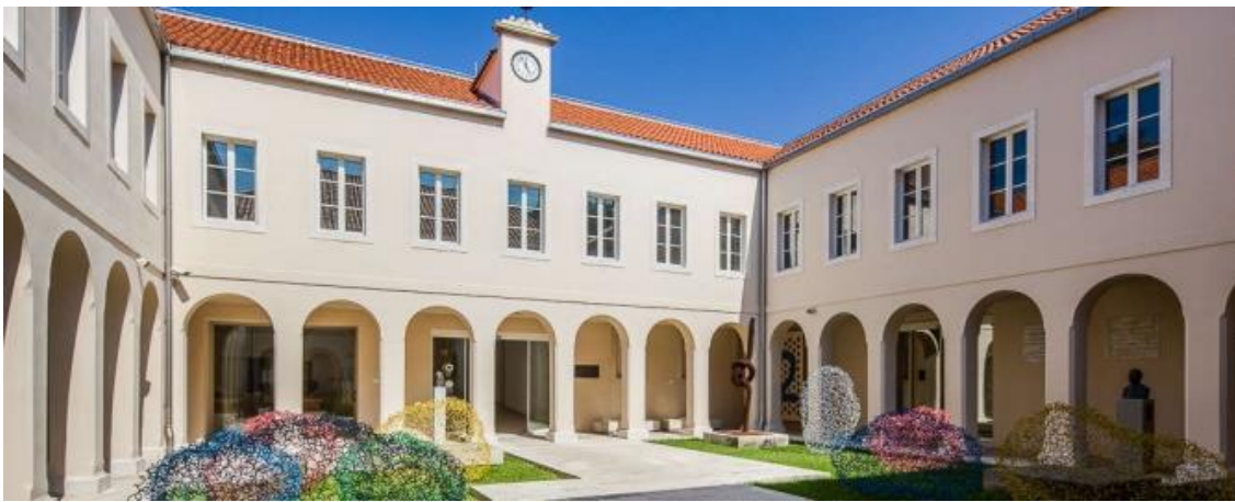
Slika 9. Galerija umjetnina Split