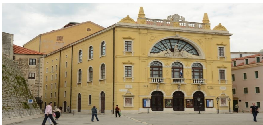
Slika 11. Hrvatsko narodno kazalište u Splitu