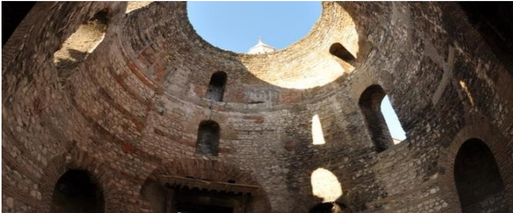
Slika 4. Vestibul