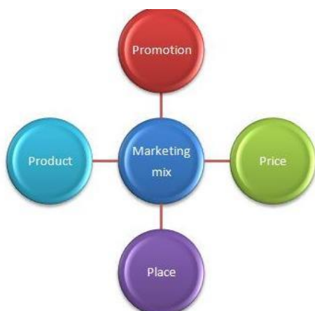
Slika 2: Elementi promotivnog miksa

Promociju možemo gledati i kao ključni element marketinškog miksa jer kad se proizvod uvodi na tržište glavno je da se on promovira na tržištu jer bez prave promocije proizvod ne može uspjeti. Za proizvode koji su već na tržištu i poznati su kupcima naglasak je na podsjećanje, odnosno utvrđivanje postojećih vjerovanja potrošača.