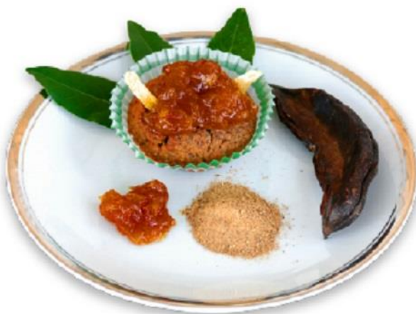
Slika 8 - Izvor: internet stranica www.cukarin.hr

To je kolač od rogača u papirnoj košarici. Sladak i mirisni plod, hrana je još iz biblijskih vremena, a u ovom slučaju sljubljen s čupavom kapom domaće marmelade skupa sa korom od naranče. Ovu deliciju svakako trebate probati.