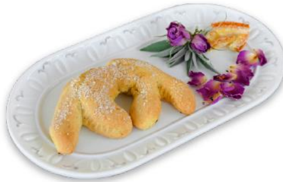
Slika 4

Ovaj, oblikom zanimljiv i naoko jednostavan suhi kolačić jednostavno se topi u ustima i na nepcu ostavlja cijelu filharmoniju prirodnih esencija limuna i naranče s blagim doticajem i mirisom dalmatinskog sunca. Tradicionalno se jede umočen u slatko vino Prošek. Kušajte jednom i garantirano ćete postati trajni obožavatelj! Svaki ovaj, kao i slijedeći kolači, mijese se i oblikuje ručno, pa se može reći da je svaki komad jedinstven i unikatan.