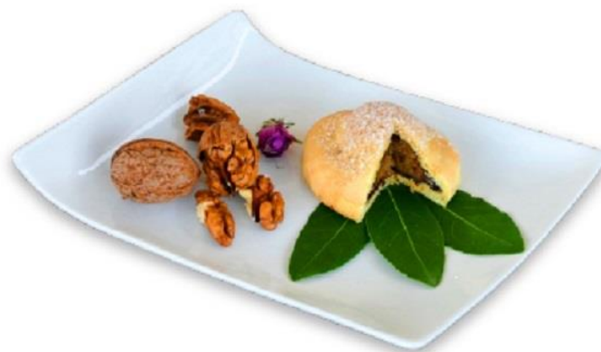
Slika 5

Također izrađen od istog svijetlog tijesta sa slatkim iznenađenjem u sredini! Kada zubi prođu kroz tanku opnu mirisnog, prhkog tijesta, zaustave se na moment na bogatom punjenju od oraha prožetom mirisnom esencijom domaće rakije od ruža. Svi ostali božanstveni okusi, koji se stvaraju u ustima daju se samo naslutiti.