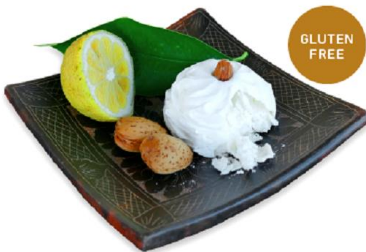
Slika 11

Ovi gluten free kolači rade se po staroj zaboravljenoj recepturi od bjeljanka šećera, vanilije i soka limuna. Spomilje je naziv od spomena na njihov okus i kad se jednom probaju nepce ih ne zaboravlja.