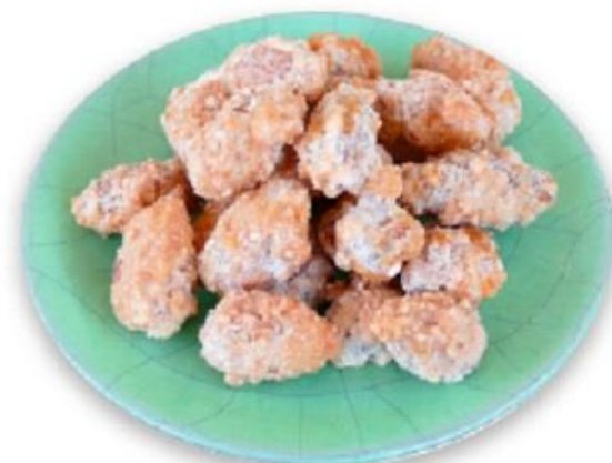
Slika 9 - Izvor: internet stranica www.cukarin.hr

Mindele su Rimljani kao dar donosili prijateljima, a na vjenčanjima su bacali na mladence kao simbol plodnosti. Naše su none ili bake bruštulavale dugi niz godina do danas. Vrlo popularni, jednostavni slatki užitek.