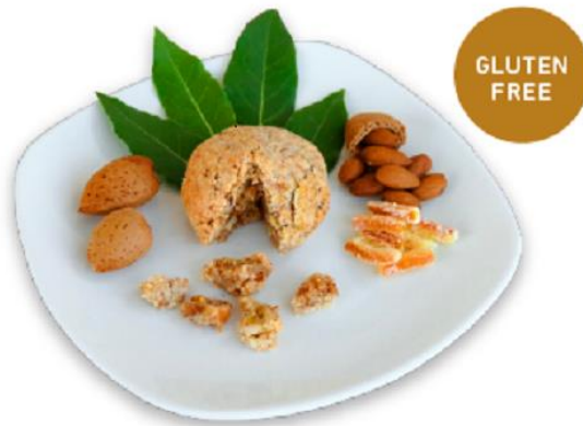
Slika 6

Svjetlo-zlatne amarete, po nekima kolač tajanstvenih afrodisizijačkih moći. U ovoj profinjenoj gluten free smjesi bogatog okusa dominiraju mljeveni mindoli (bademi) s jasnim zamamnim mirisom korice od limuna i naranče. Ali ostali neodoljivi okusi se ne daju dešifrirati! Mnogi tvrde da u sastavu ima i meda i suhих smokava, no, što je zapravo istina, ostavimo kao izazovnu tajnu.