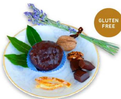
Slika 7

Ime asocirano oblikom topovske kugle, a na spomen svjetski poznate bitke u kojoj je zarobljen MARKO POLO i koja se odvijala baš ispred grada Korčule. Bombica “Marko Polo” je kreativni proizvod novog doba, koji će tek ući u korčulansku tradiciju. Riječ je o prvoj gluten free kalorijskoj bombi – kuglici od fine kreme, posute fino sjeckanim orasima, a zatim omotane debelim slojem čokolade. Kod ove deliciozne kombinacije dolaze na svoje obožavatelji čokolade.