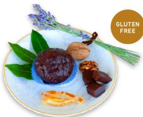
Slika 7

Ime asocirano oblikom topovske kugle, a na spomen svjetski poznate bitke u kojoj je zarobljen MARKO POLO i koja se odvijala baš ispred grada Korčule. Bombica “Marko Polo” je kreativni proizvod novog doba, koji će tek ući u korčulansku tradiciju. Riječ je o prvoj gluten free kalorijskoj bombi – kuglici od fine kreme, posute fino sjeckanim orasima, a zatim omotane debelim slojem čokolade. Kod ove deliciozne kombinacije dolaze na svoje obožavatelji čokolade.