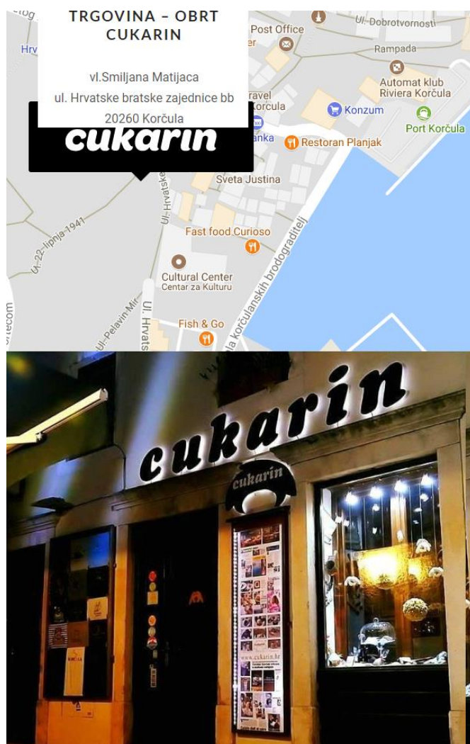
Slika 3