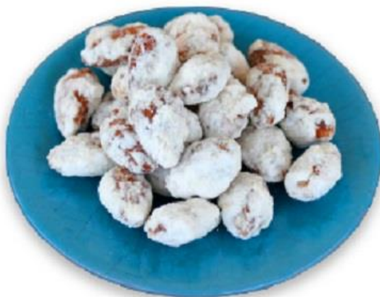
Slika 10

Za vjenčanja, krštenja, pričesti i drugih prigoda u Korčuli su se posebno spravljali mindeli na „bilo“. Jednako zarazno mirisni i hrskavi.