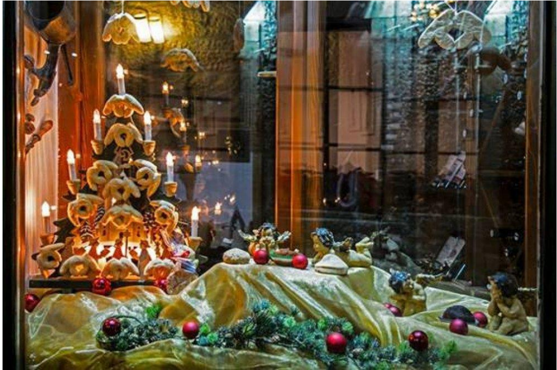
Slika 12 (Tiha noć u Cukarinovu izlogu)