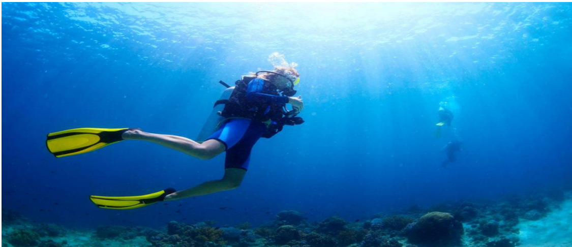
Slika 8: Ronjenje s bocama

Niska i razvedena obala, s brojnim otocima, uvalama i plažama tvore atraktivne krajobraze u Zadarskoj županiji, koji su već prepoznati i turistički valorizirani te se u njima provode brojne turističke aktivnosti. Neosporno je da je more osnovni turistički resurs na kojem se temelji turistička ponuda na ovom području. Obilježja mediteranske klime, razvedenost obale i iznimno pogodni vjetrovi zadarski i biogradski kanal čine vrlo atraktivnim i pogodnim za nautički turizam, i na kojima se već održavaju brojne regate sa međunarodnim sudjelovanjima. Podmorje otoka posebno je bogato ribom te ostalom podmorskom florom i faunom koja čini osnovu za razvoj ronilačkog i ribolovnog turizma.