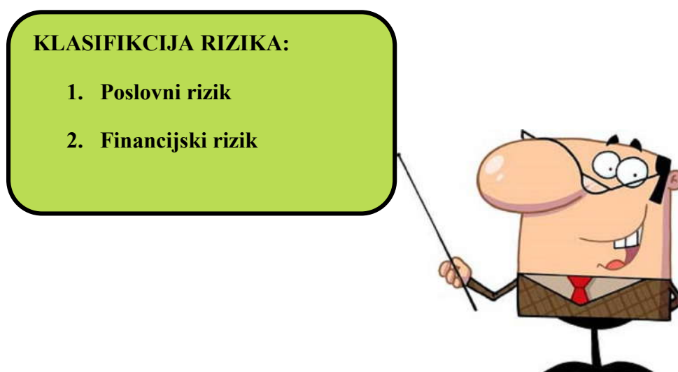
Slika 2 : Osnovna podjela rizika

Postoje različite podjele rizika u poslovanju banka, pri čemu velika brojnost izvora u bankarskom poslovanju otežava njihovu podjelu i grupiranje. Slijedom navedenog, ovakav pristup dozvoljava i različite podpodjele i kombinacije ovisno o svrsi i predmetu istraživanja. Sukladno niže navedenoj shemi, gruba podjela bankarskih rizika u procesu donošenja odluka svrstava rizike u dvije osnovne neformalne skupine: skupinu poslovnih rizika te skupinu financijskih rizika.