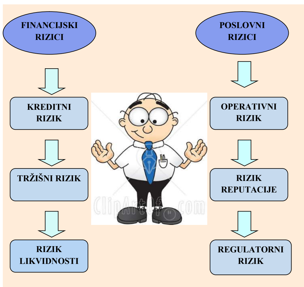
Slika 3 : Financijski i poslovni rizici

profitabilnosti bankovnog poslovanja. 49 Upravljanje rizicima kao kontrolna funkcija odabrane Banke na području Splitsko – dalmatinske županije organizirano djeluje u okviru Sektora za upravljanje rizicima u skladu sa Zakonom o kreditnim institucijama te internim direktivama i politikama. Temeljem prethodno provedene razdiobe rizika na dvije neformalno formulisane skupine, u nastavku svakoj skupini je pridružena odgovarajuća podskupina rizika. 50