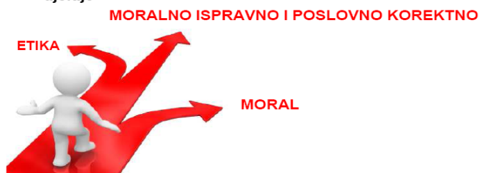
Slika 1. Etika i moral

Bez obzira o kojoj se etici radilo ona uvijek ima zadatak da se djeluje