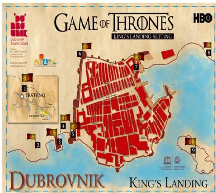
Slika 3 Karta grada Dubrovnika za lokacije snimanja Igre prijestolja