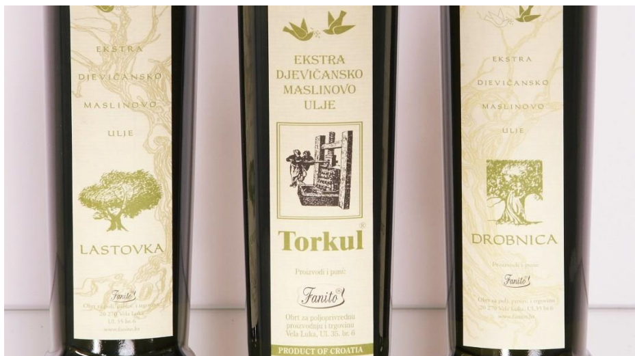
Slika 9: ulje Torkul

Fascinantna mi je doza ljubavi i požrtvornosti koju su naši ljudi spremni proći i prolaze za dobrobit svoje obitelji. Što se tiče poslovanja na otoku definitivno je otežano, učinci izoliranosti se reflektiraju na svim razinama poslovanja... Ali o tome uopće ne razmišljam jer ti u samom početku kao pokretač stoji želja da ostaneš na otok to jest doma. Da opstane poduzeće danas nije lako ali je definitivno moguće. Ako se dozvoli ravnopravnost u tržišnoj utakmici onda je definitivno moguće. Ja volim i uživam u našem poslu. Baš ga volim i iznimno poštuju svoje i cili svoj škoj. Iskreno to me najviše i vratilo nakon studija ekonomije u Splitu i zadnja opcija mi je otići iz otoka Korčule“.