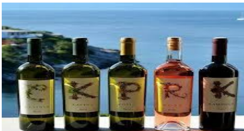
Slika 8: vina vinarije Bačić

Petar smatra da je na otoku pogodno za proizvodnju vina jer je vino proizvod koji je cijenjen u svijetu, s vremenom će poslovanje možda postati teže zbog velike konkurencije ali ujedno lakše zbog razijanja elitnog turizma sve je veći broj restorana koji traže vrhunska vina za strane i domaće goste. Ovakva vrsta turizma kako Petar kaže uvelike će im olakšati brendiranje proizvoda i jačanje tržišne cijene.