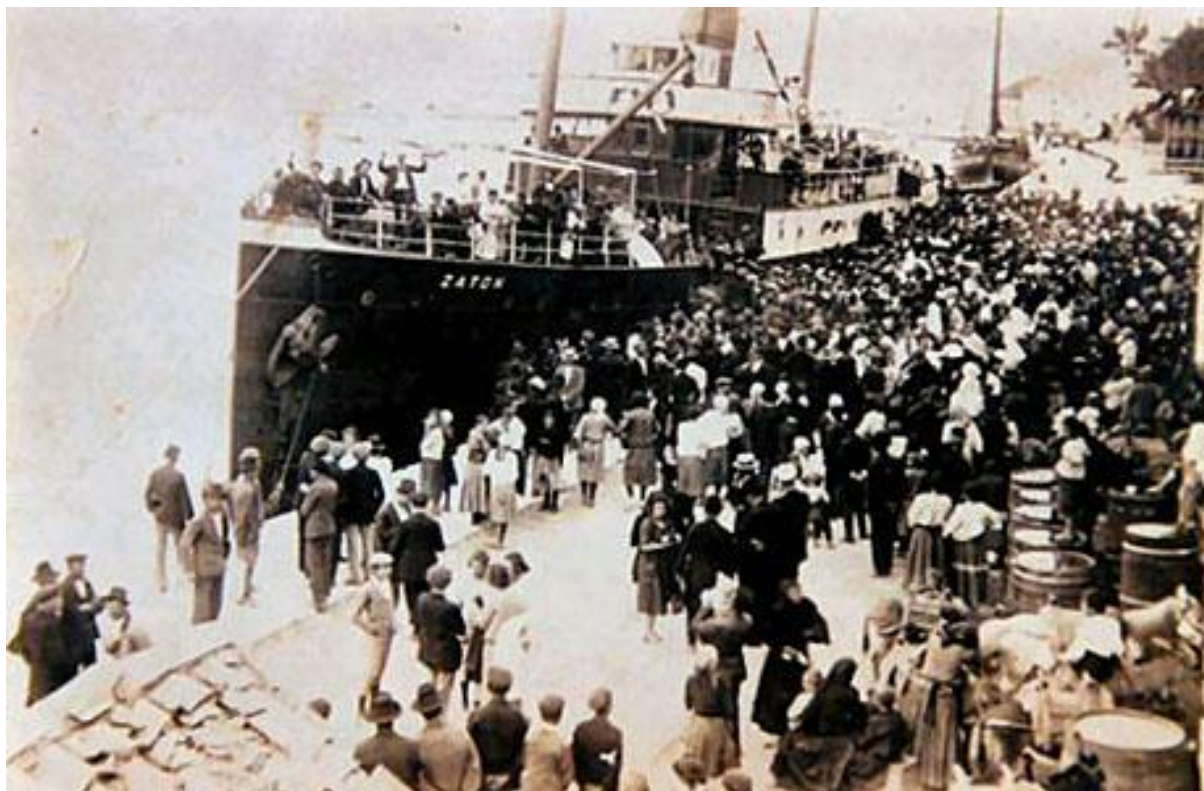
Slika 6: masovno iseljavanje blaćana iz luke Prigradica