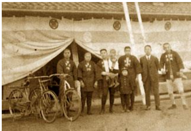
Slika 2: radnici poduzeća Kongo-Gumi