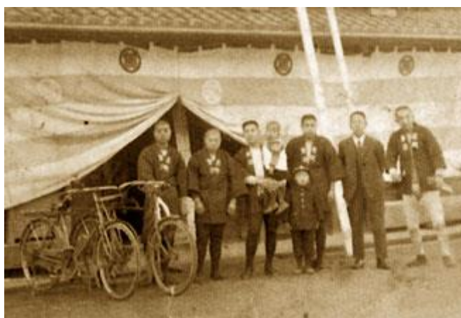
Slika 2: radnici poduzeća Kongo-Gumi