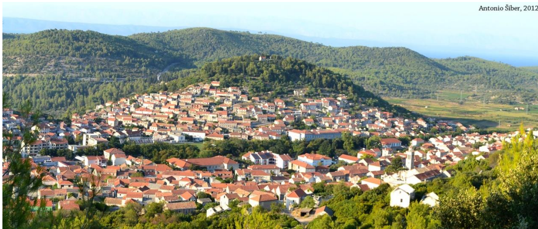
Slika 5: mjesto Blato,otok Korčula