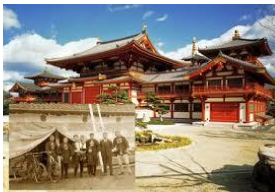
Slika 1: Najstarije obiteljsko poduzeće Kongo Gumi