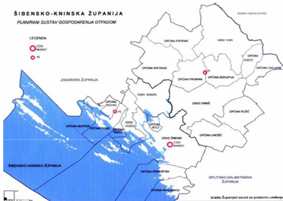
Slika 2. Šibensko – kninska županija