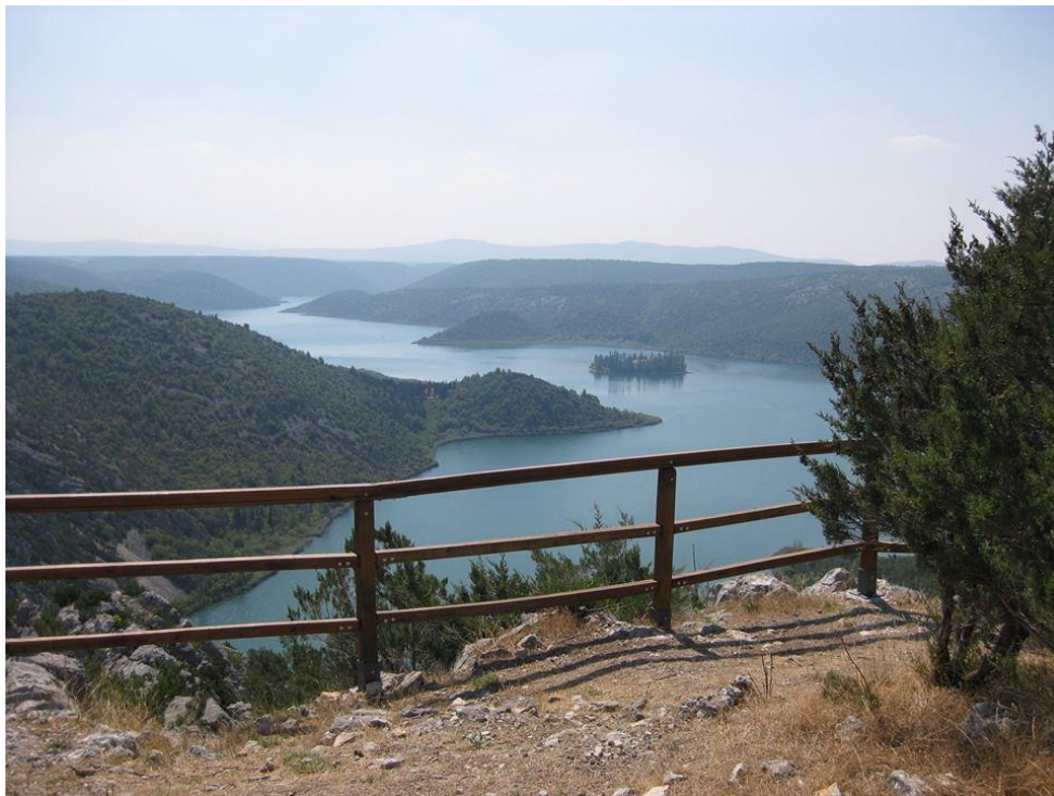
Slika 8. Staza Torak

Područje Drniša solidno je pokriveno stazama (rutama), a proteže se sve do poveznih područja s ostalim zonama. Jako je dobra poveznica prema NP Krka, što je dobro imajući na umu trenutnu razvijenost biciklističkih staza u NP Krka te planove daljnjih investicija. Jedina staza koja se vraća dijelom istom stazom je staza Torak , no s obzirom na njenu specifičnost to je zanemarivo tj. prihvatljivo (Operativni plan razvoja cikloturizma Šibensko-Kninske županije 2018. - 2020.).