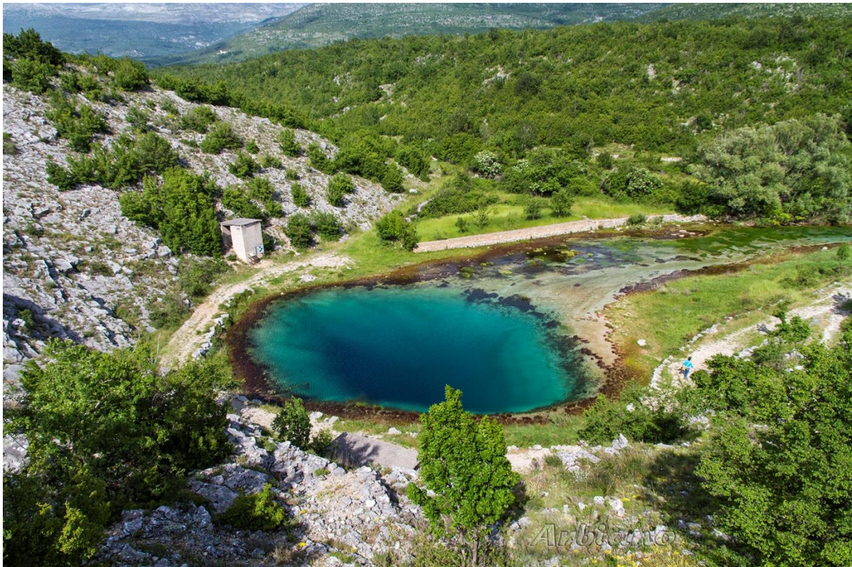
Slika 9. Staza Put vrele Cetine

Dvanaest staza na području Knina odlično je osmišljeno i posloženo, pravilno se šire oko Knina i pokrivaju cijelo područje i razne staze. Jedine staze koje odstupaju od kružnog koncepta su Uspón na Dinaru , što je dijelom uvjetovano konfiguracijom terena te staza Put vrele Cetine , koja većim dijelom odlazi i vraća se istom dionicom.