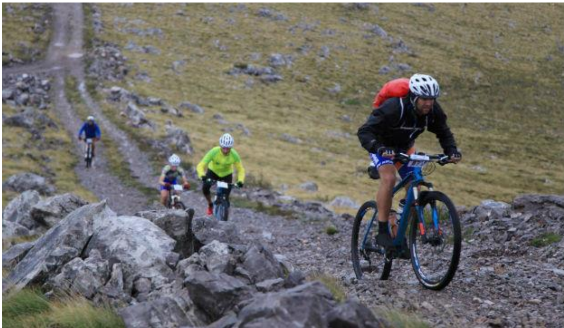
Slika 7. Staza Orlov krug

i druge. Ovakve staze dosta su nepraktične za goste s obzirom da se biciklisti u pravilu sami vraćaju biciklima, pri čemu je povratak istom dionicom, pogotovo ako je to većina ili cijela staza, uglavnom nepoželjno, a to je situacija kod većine staza ovog tipa. Određeni dio staza ovakvog tipa mogao bi se prikazati kao poveznica nekih područja ili način transporta biciklom do značajnih znamenitosti, poput staza „ Pirovac-Sv. Martin “, „ Kula Kašić-Vransko jezero “, „ Lokva-Plana “ (mala je, lokalna i vodi direktnim putem izvan naselja), Skradin-Visovačko jezero , iako je poželjno da i ovakve staze budu kružne, s obzirom da se kao takve i koriste. Specifičan tip staza, kao staza „ Orlov krug “, koja je zapravo staza biciklističke utrke, poželjno je da ostaju u svom izvornom obliku te da se jasno naznači da je to takav tip staze. Na primjer stazu „ Orlov krug “ uglavnom će moći izvesti samo vrlo vješti biciklisti koji ciljano traže takav sadržaj.