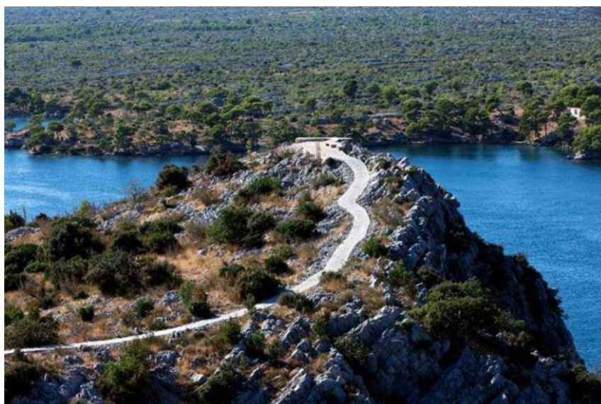
Slika 6. Kanal Sv. Ante

Petnaestak staza na području grada Šibenika (s par izuzetaka) dobar su primjer kako bi se trebale raditi kružne staze, po mogućnosti da povezuju mjesta visokog interesa – poput tvrđava kojima Šibenik obiluje u samom gradskom središtu ili na njegovim rubnim područjima, posebice prema kanalu Sv. Ante i tvrđavi Sv. Nikole.