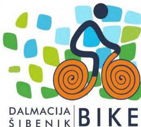
Slika 4. Logotip cikloturizma Šibenika

Razvoj cikloturizma na području Šibensko-kninske županije odvijao se uglavnom na nivou lokalnih turističkih zajednica, s manjim utjecajem županijske turističke zajednice. S obzirom na različite mogućnosti i prioritete, proizvod cikloturizma razvijao se vrlo različito - na jednom području su bile izrađene karte, označene staze, osmišljen određeni online sustav na raspolaganju gostima, dok su na drugome jedva postojale staze (ili ih još nije bilo). 2015. godine županijska TZ preuzela je inicijativu izrade plana sustavnog razvoja cikloturizma s namjerom da ga podrže i u njemu participiraju sve, ili većina, lokalnih samouprava odnosno lokalnih turističkih zajednica. Krajem iste godine potpisan je Sporazum o suradnji na razvoju cikloturizma u Šibenskoj-kninskoj županiji koji su potpisale sve lokalne turističke zajednice. U Sporazumu je definiran iznos koji će svaki od partnera uložiti u razvoj cikloturizma u 2016. godini i za koje aktivnosti. Pri tome je županijska TZ preuzela obvezu najvećeg iznosa investiranja, poglavito usmjerenog na definiranje standarda i smjernica za razvoj, uz dodatna sredstava za operativna i infrastrukturna ulaganja (Operativni plan razvoja cikloturizma Šibensko-Kninske županije 2018. - 2020.).