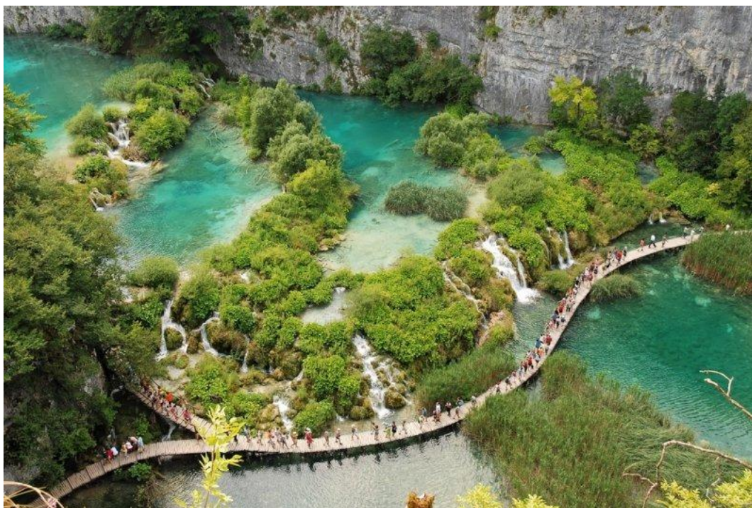
Slika 3. Nacionalni park Krka

Nacionalni park Krka obuhvaća područje uz rijeku Krku koja izvire sjeveroistočno od Knina, teče kroz dubok i živopisan kanjon, dug 75 km; tvori bočne slapove-Krčić, Risnjak, Miljacku, Roški slap (visok 26 m) i znameniti Skradinski buk (Slapovi Krke 46 m), koji je najveća sedrena barijera u Europi. Svojim donjim tokom rijeka Krka protječe kroz Pukljansko jezero, te utječe u 9 km dugačak Šibenski zaljev. U NP Krka posebno se ističu dva kulturno-povijesna spomenika: franjevački samostan na otoku Visovcu i manastir «Krka», a u nizu slikovitih naselja na području Parka najzanimljiviji je Skradin, gradić zaštićen kao spomenik kulture ( http://sibensko-kninska-zupanija.hr/stranica/opi-podaci/70 , 25.06.2018.).